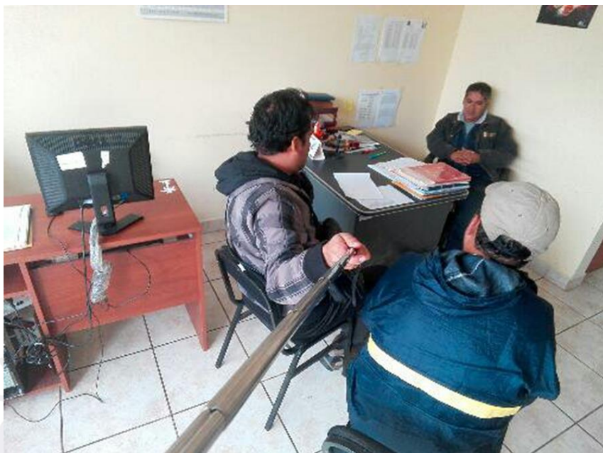
Figura 22 Entrevista con administrador del camal municipal.

Fecha de entrevista: 22 de marzo de 2016