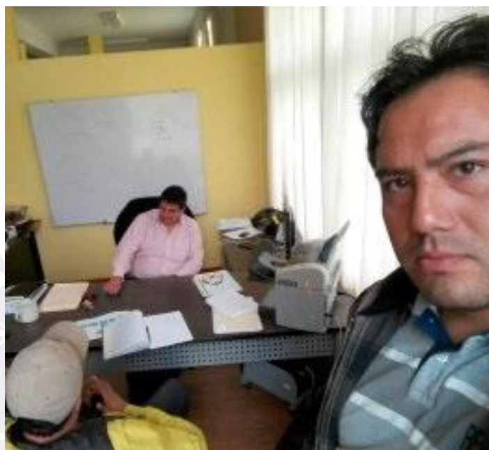
Figura 20 Entrevista con gerente de desarrollo económico.

Fecha de entrevista: 21 de marzo de 2016