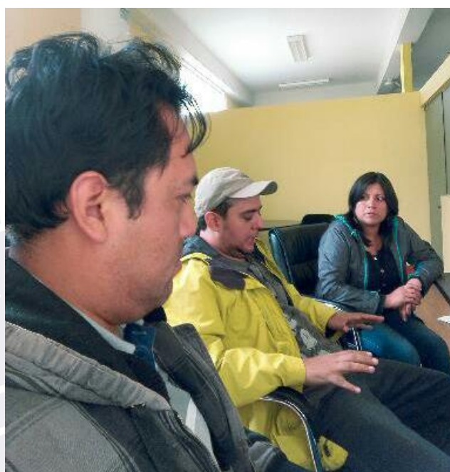
Figura 19 Entrevista con administradora de campo ferial Iscoconga.

Fecha de entrevista: 21 de marzo de 2016