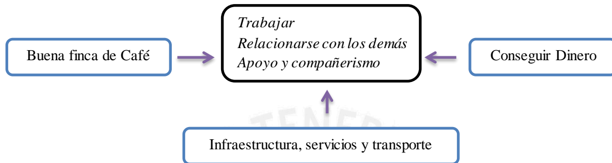
Figura 2: Relación entre Valores y Metas de Bienestar de los pobladores de San Lorenzo

descritos previamente en la estructura organizativa vecinal y la relación con autoridades locales. Por este motivo, estos aspectos axiológicos se comprenden como las guías de conducta necesarias para poder alcanzar dicha meta. En el caso de Educación para los hijos , no se ha encontrado una relación lo suficientemente clara entre la meta y los valores identificados.