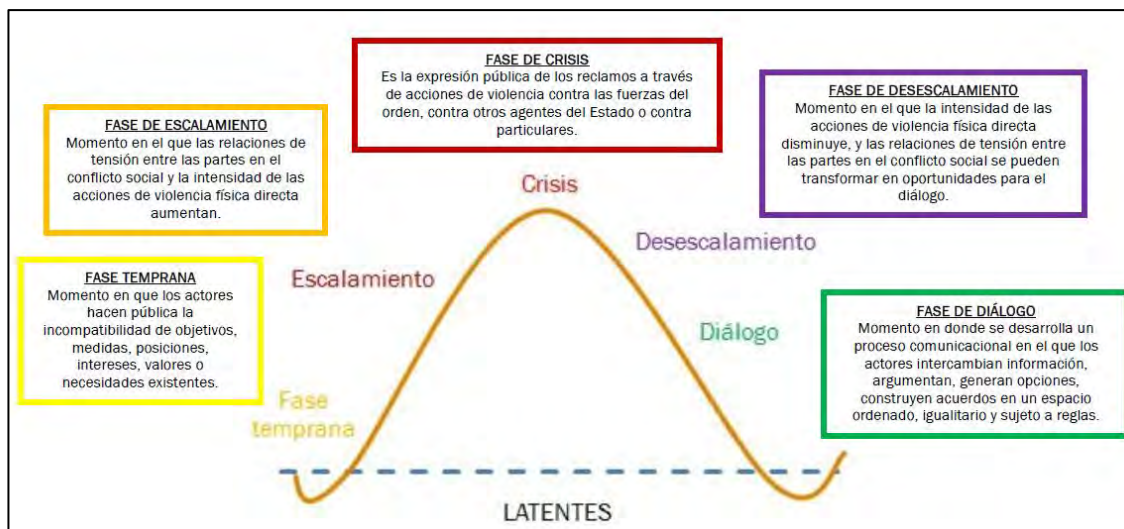
Figura 3: Fase de los Conflictos Activos

Fuente: Defensoría del Pueblo - Junio 2012, pág. 4