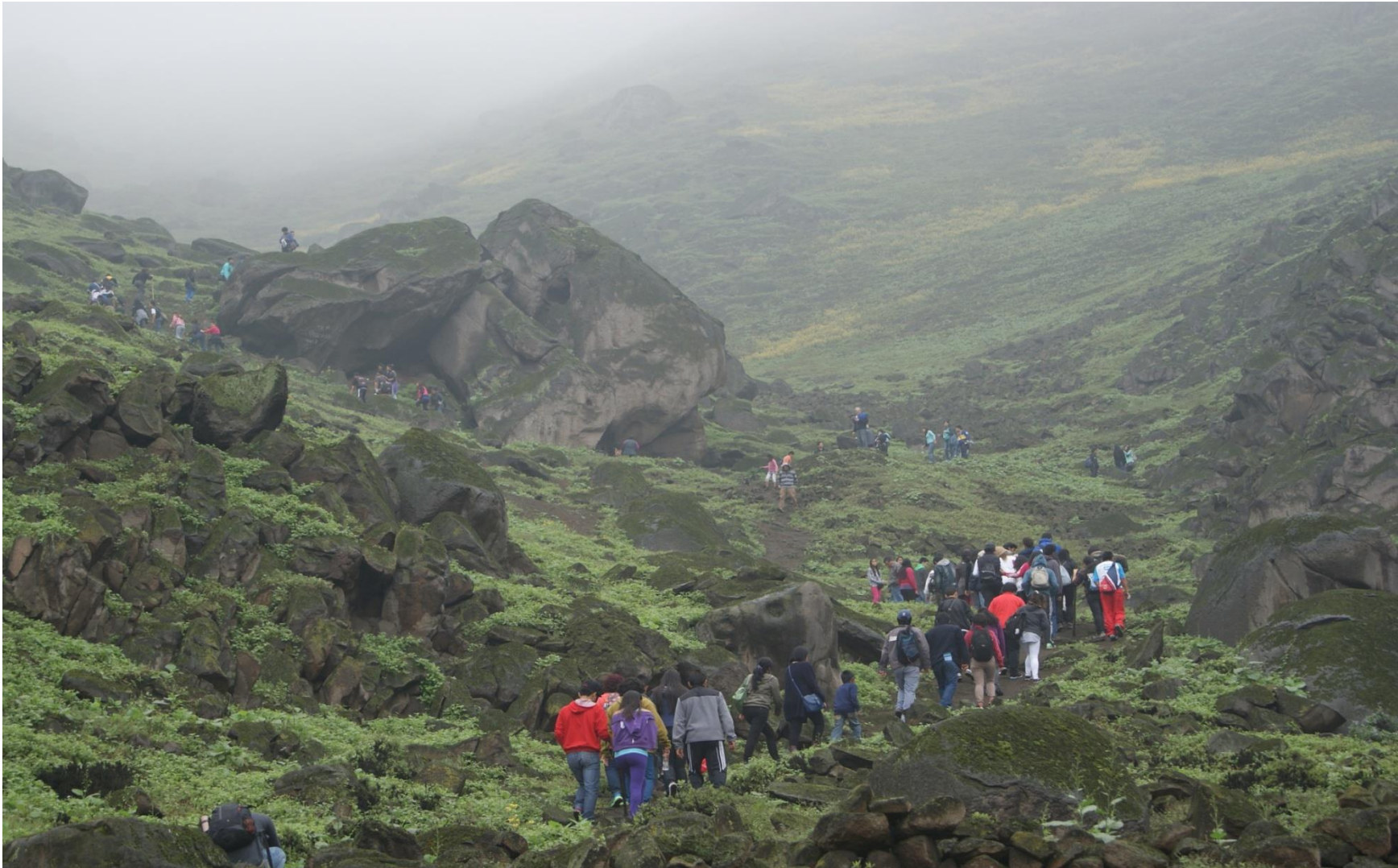
Setiembre 2012.