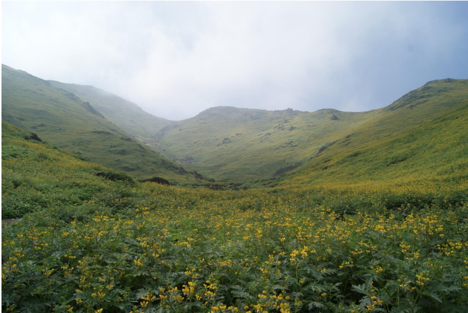
Agosto 2012.