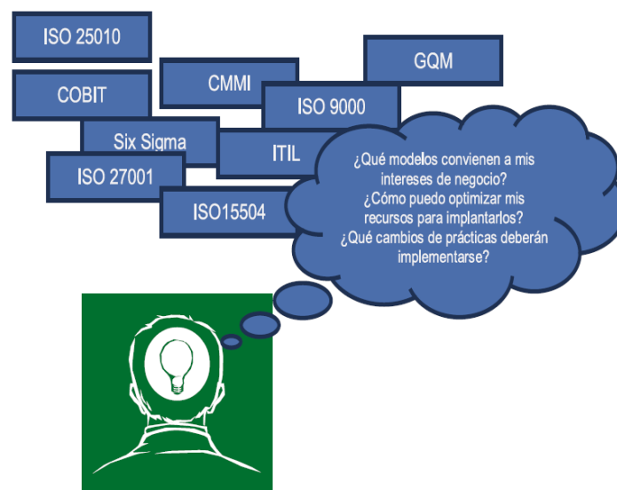
Figura 01. Modelos de calidad más comunes que las organizaciones toman en cuenta para implantarlos [19].

múltiples modelos de calidad. Entonces surgen un conjunto de interrogantes, ¿Qué se puede hacer para lograr los beneficios que señalan los modelos y al mismo tiempo, reducir los costos de implantación y evaluación?, ¿Cómo afrontar los cambios que se dan en los estándares como resultado de su evolución inherente?, ¿Cómo mantener la alineación con los procesos implantados en la organización?, y ¿Cómo se pueden reutilizar los productos generados y la experiencia obtenida de la implantación de un modelo para reducir costos en la implantación de uno nuevo?