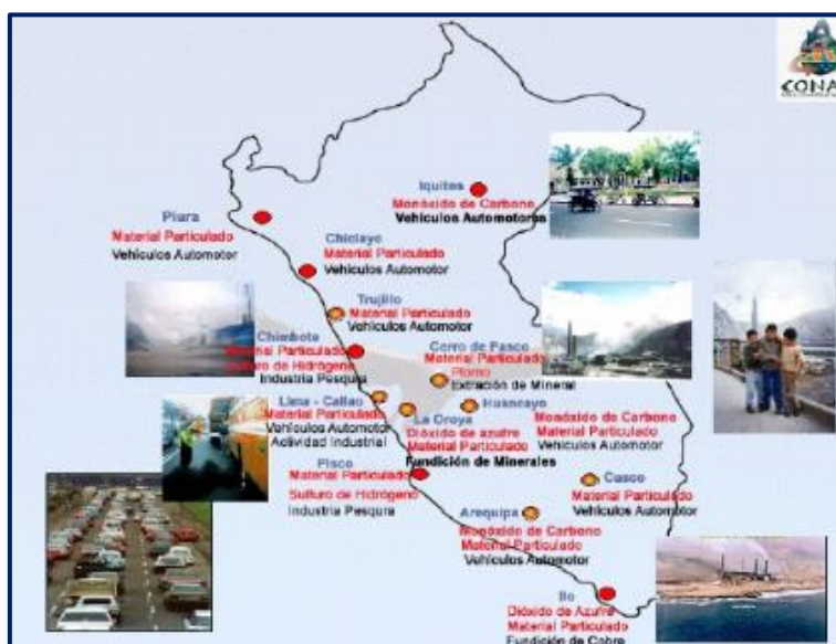
Gráfico 1: PRINCIPALES ZONAS AFECTADAS POR LA CONTAMINACIÓN DEL AIRE