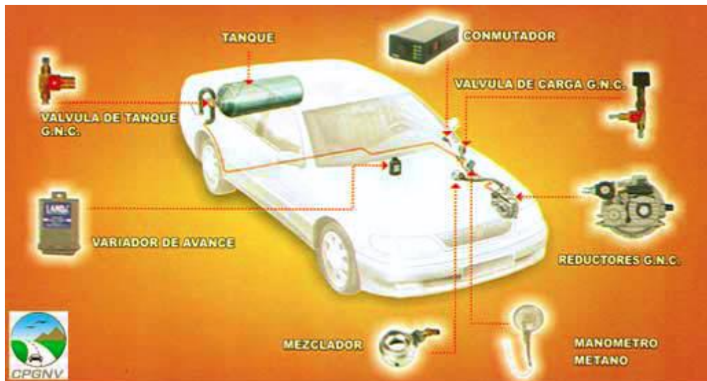
Gráfico 3: Modo de Conversión del Automóvil

Los componentes del equipo completo de conversión deben de cumplir ese el punto de vista de su fabricación y seguridad con los requisitos de ensayo especificado para cada uno de ellos en las Normas Técnicas respectivas.