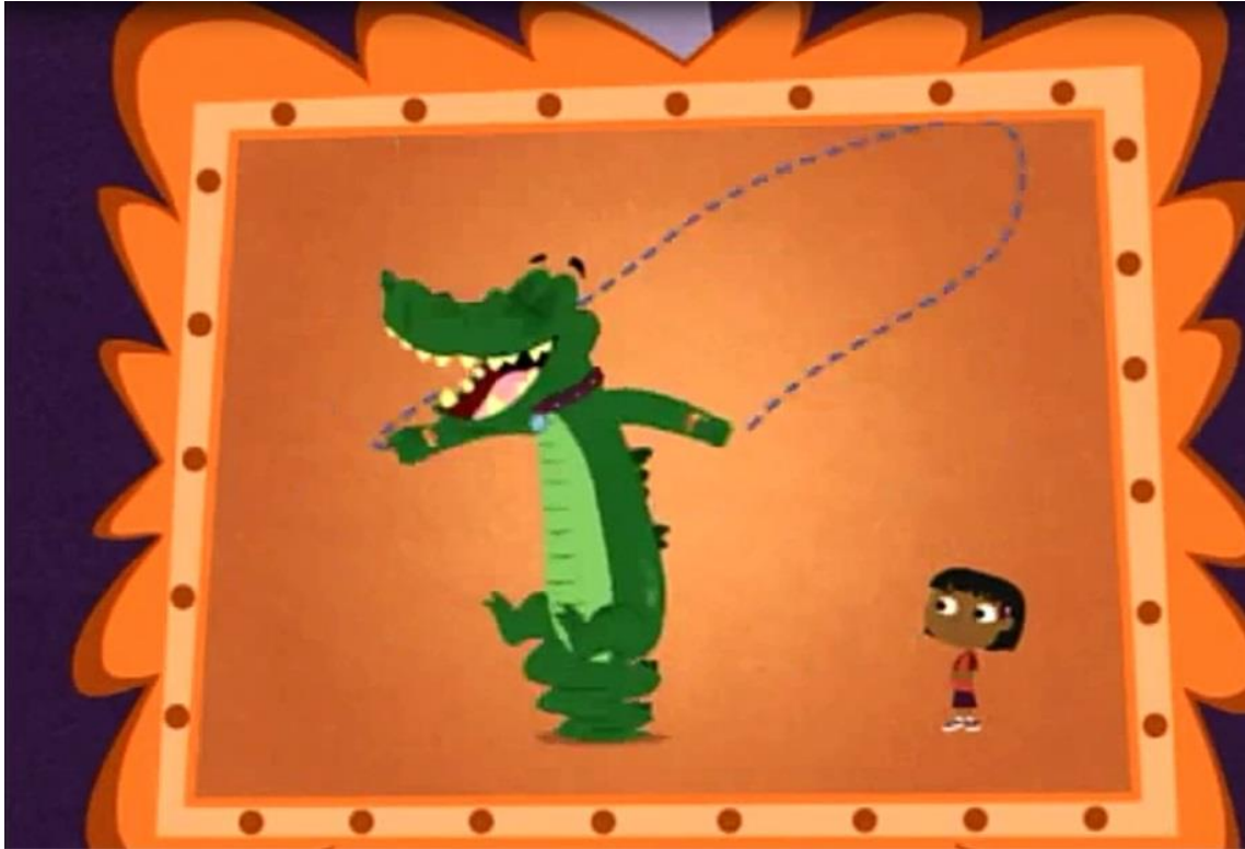
¿Ponerse a jugar con la sogá?