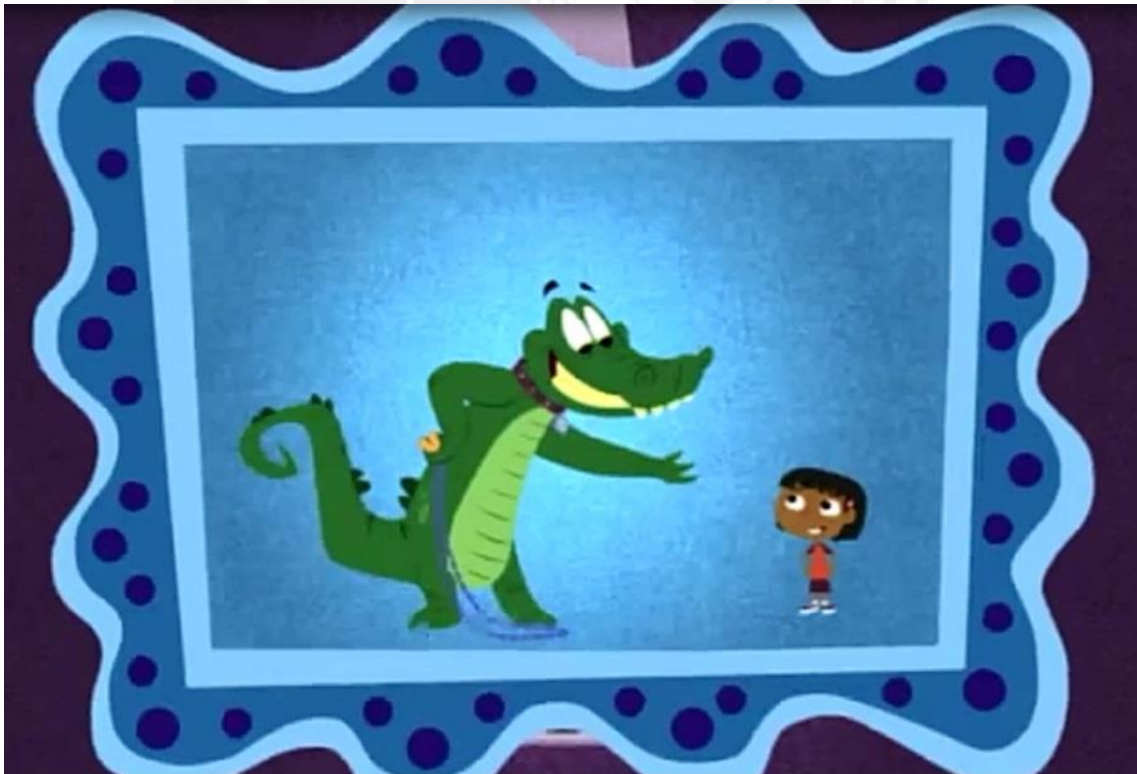
¿Decirle gracias a Chloe?

(Se debe guiar las respuestas de los niños y ayudarlos a comprender que debe agradecer)