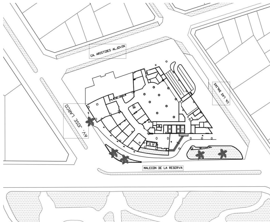
Figura 5: Planta primer nivel Hotel Marriott

El edificio, como ya se mencionó parte de la configuración de una torre de oficinas y un hotel, las cuales se encuentran integradas por un zócalo comercial que incluye tiendas como cafeterías, un casino y una joyería. Además, los accesos son directamente desde la calle. De esta manera, como peatones nos otorga una experiencia más interesante, además de seguridad, con relación al borde urbano del edificio. De acuerdo con ello, se configura un importante ‘borde blando’ 1 , sin embargo, según Gehl la relación de esta planta baja y su uso comercial debe ser asociado a la fachada.