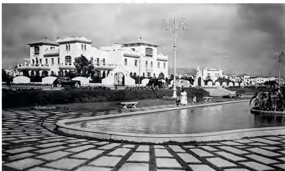
Figura 3: Casona de la familia Aparicio-Porta en 1953 antes de la construcción del hotel Marriott

La casona se puede observar en la Figura 3, considerada también como mansión. Notemos su presencia mayor a las del entorno, con un frontis principal con una entrada en arco, una volumetría sedimentada que muestra estratificación social al interior. Aparentemente, por las tejas, balcones, paredes en blanco y portada ornamental, una especie de neocolonial y neorrenacentista.