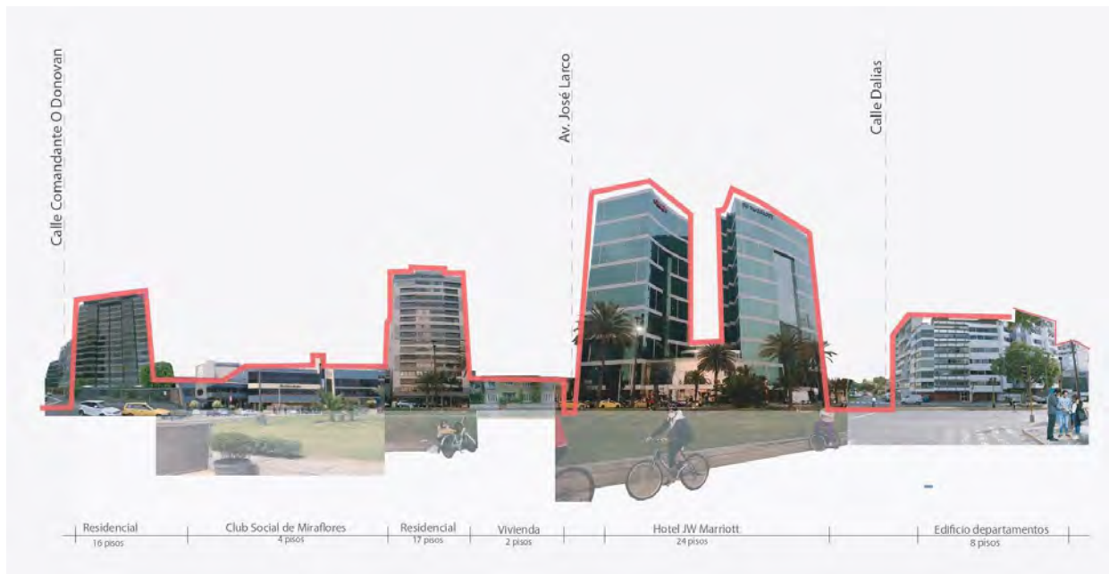
Figura 4: Perfil urbano actual Malecón de la Reserva

Como se puede observar en la Figura 4, el nuevo perfil urbano actual en el Malecón de la Reserva ha crecido verticalmente, instalándose alrededor del hotel Marriott, nuevos edificios de departamentos de 16, 17, y 8 pisos.