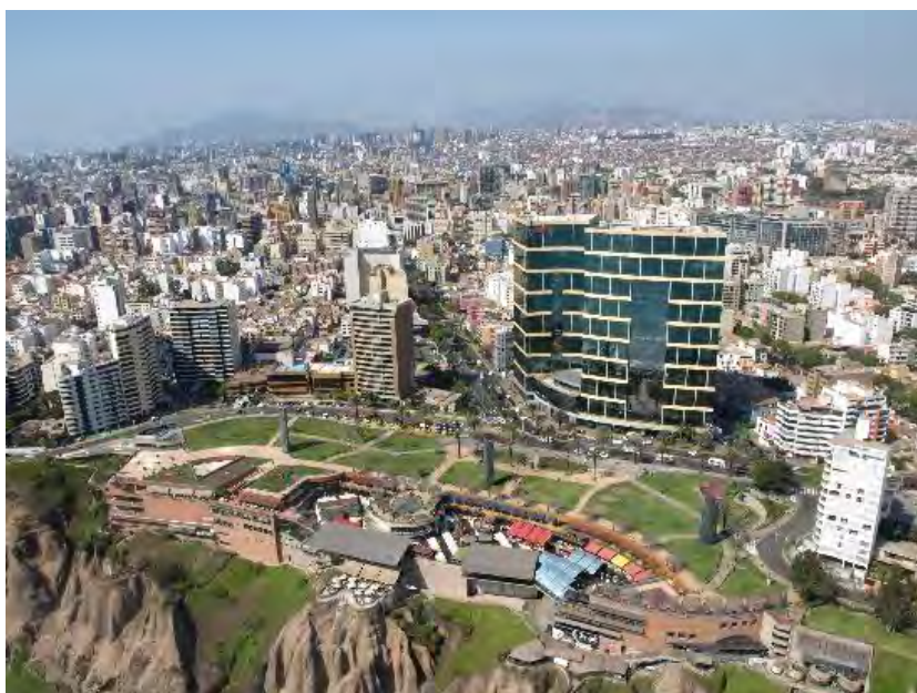
Figura 2: Vista aérea Larcomar en 2016

Hoy en la actualidad, Larcomar es un hito a nivel metropolitano, y ha ido evolucionando en su entorno inmediato. Tal como menciona Powell en su libro La transformación de la ciudad: 25 proyectos internacionales de arquitectura urbana a principios del siglo XXI (2000), si ubicamos un nuevo proyecto importante en escala en barrios de bajo impacto se puede convertir en una forma que prueba hacia la atracción de nuevas inversiones tanto a escala barrial como metropolitana. De esta manera, proponer un edificio u proyecto público, de inversión privada o pública se puede considerar una forma de éxito en lo económico, social, y urbano, en términos de regeneración urbana. Aunque Kenneth Powell suele referirse mayoritariamente a transformaciones urbanas en barrios degradados, tal como los llama, también se adapta a Miraflores. Todo ello mencionado permitía que esta nueva centralidad transforme positivamente la ciudad moderna hacia un desarrollo comercial, y posteriormente una atracción turística.