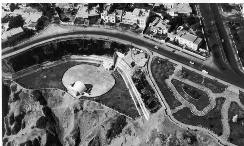
Figura 1: Vista aérea Parque Salazar en 1949

Es importante también señalar los cambios de zonificación y uso de suelo que generó su construcción, así como el desarrollo comercial que potencia este foco de atención en la ciudad. Se cambió el estilo de vida y de las personas; sin embargo, el proyecto fue pensado de tal manera que no arrebate esa parte activa que ya existía en el Parque Salazar. A pesar de estar enfocado a lo comercial y a un fuerte consumo, este espacio entre islas, como ya se mencionó anteriormente, mantiene esta vida llena de actividades, ya no solo barrial.