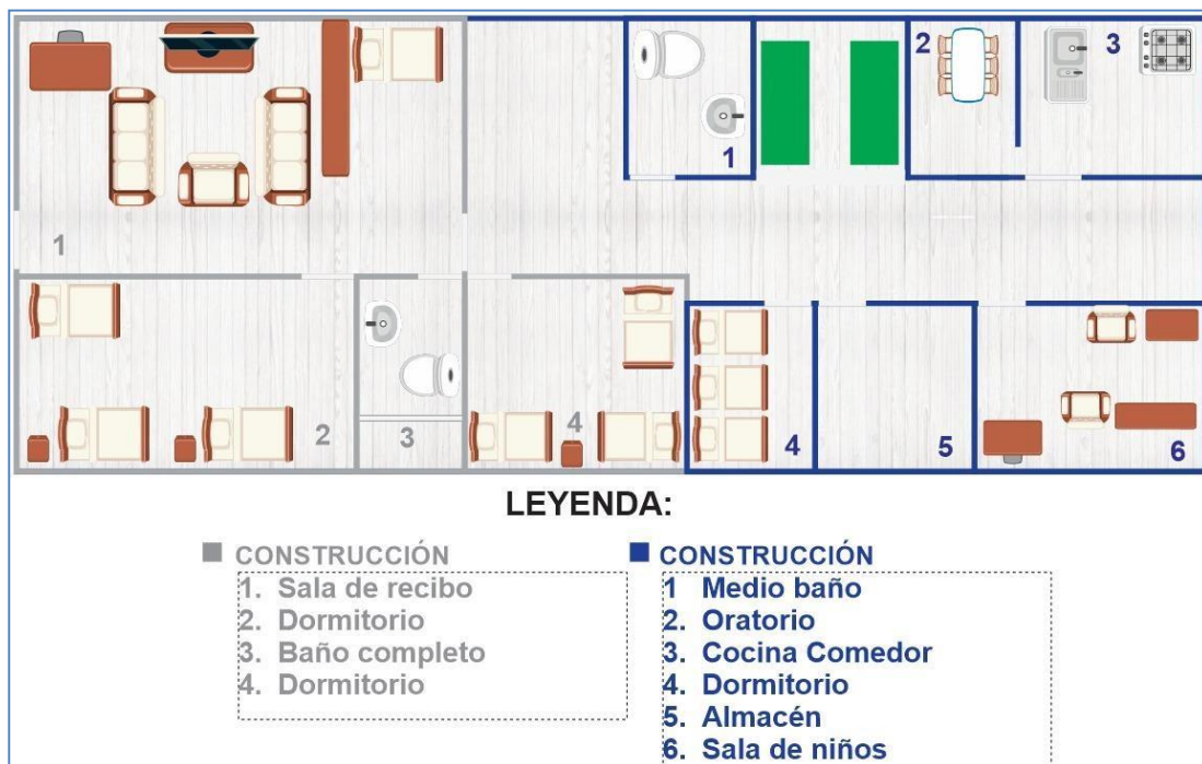
Plano de distribución de la infraestructura de la CRT ST