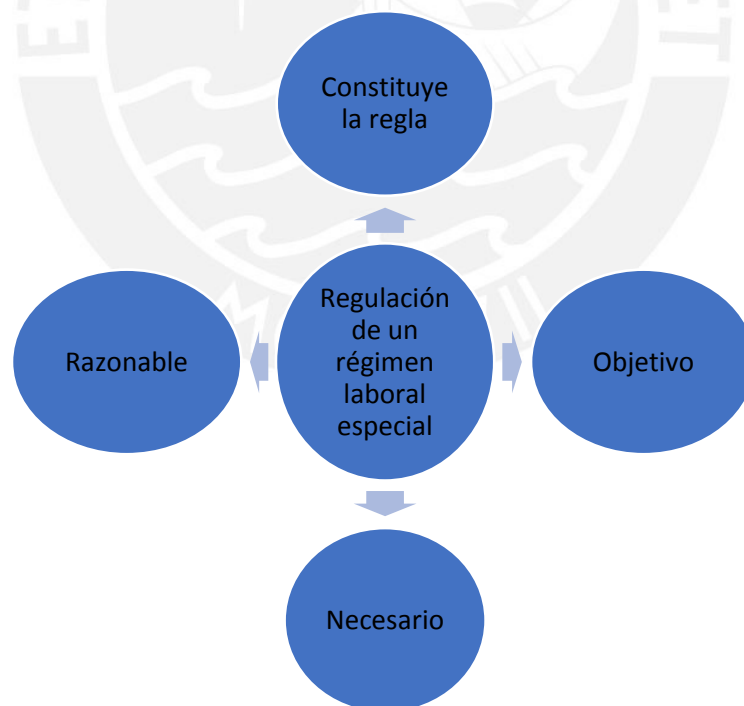
Imagen elaborada por el autor para los fines de la investigación