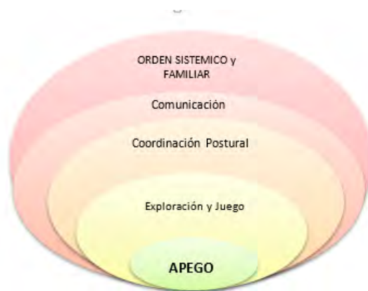
Figura 1. Organizadores de desarrollo

Organizadores de desarrollo en base al apego. Adaptado de Wallon (s.f)