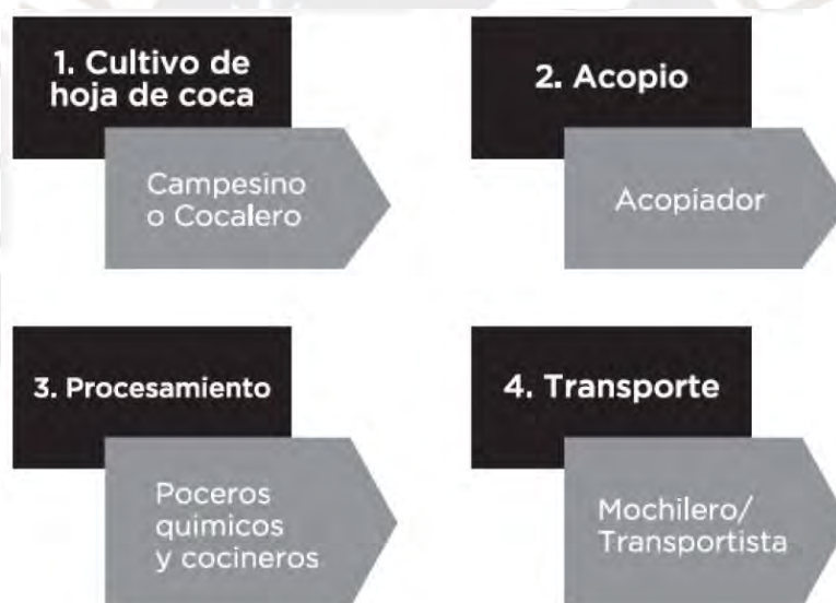
Gráfico 2. Flujograma de la cadena de valor de la cocaína

cadena de producción. Por el contrario, zonas urbanas como la ciudad de Tocache, contaban con instalaciones como el aeropuerto municipal de Tocache (CVR, 2003), que permitían que eslabones más rentables de la cadena de producción de la coca (Gráfico 1), como el transporte, pudieran llevarse a cabo en el lugar. Así, será esperable que en aquellas zonas donde hay mayor posibilidad de obtener altos beneficios económicos en un corto plazo, generalmente las zonas urbanas, experimentarán una aplicación más ligera y flexible de la ideología de la organización, de modo que se respeta la cultura de la comunidad para poder contar con la aprobación de quienes las habitan.