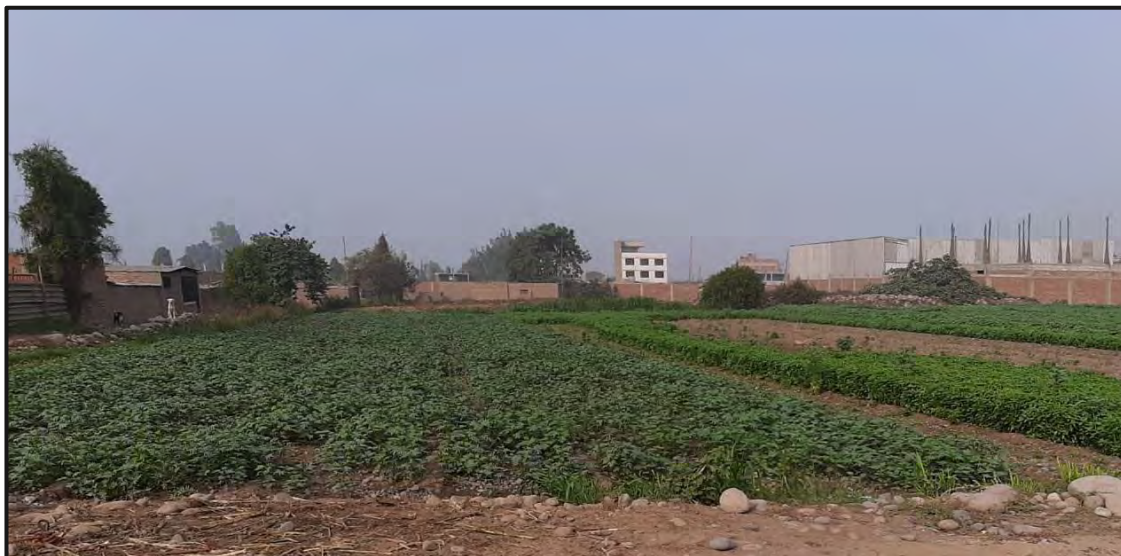
Ilustración 1. Parcela con cultivo de huacatay