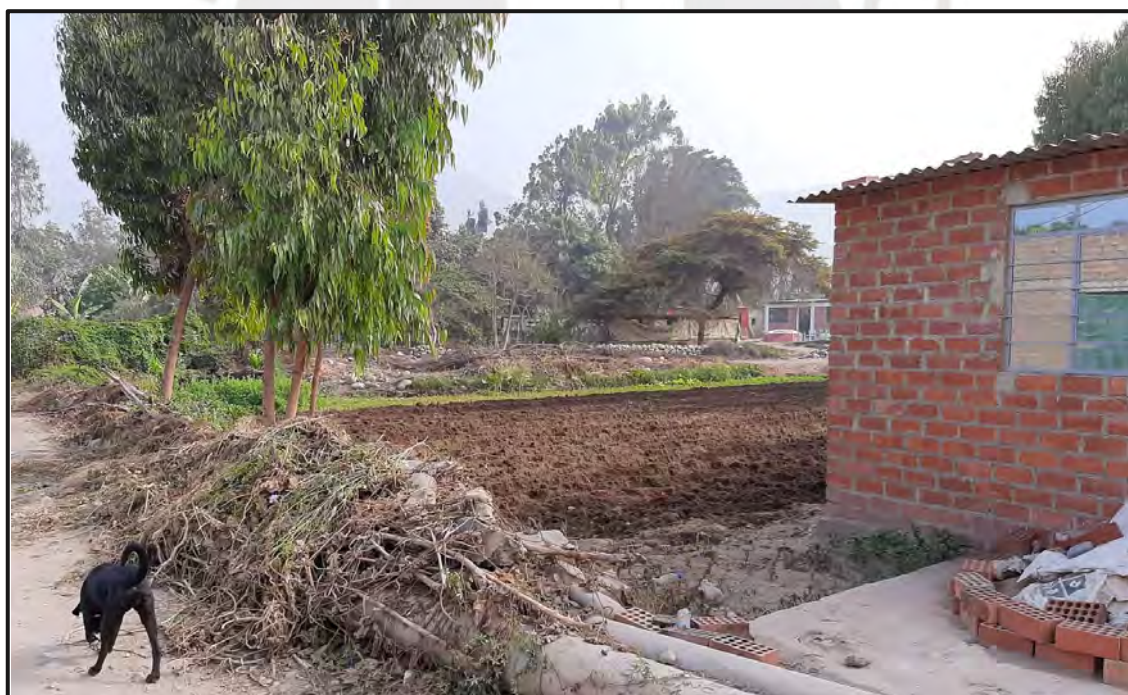
Ilustración 2. Parcela pequeña con surcos para siembra