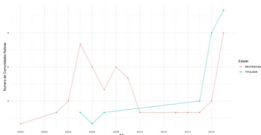
Gráfico 2: Comunidades nativas tituladas en la región de Ucayali entre los años 2000 al 2018

Fuente: Elaboración propia. En base a la Base de Datos de Pueblos Indígenas del MINCUL Año: 2018