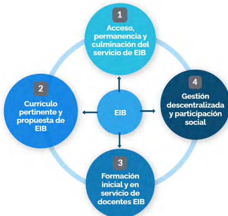
Figura N° 1: Objetivos estratégicos del PLANEIB