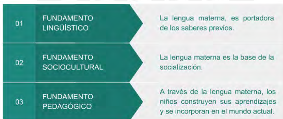
Figura N° 2: Los fundamentos de una EIB.