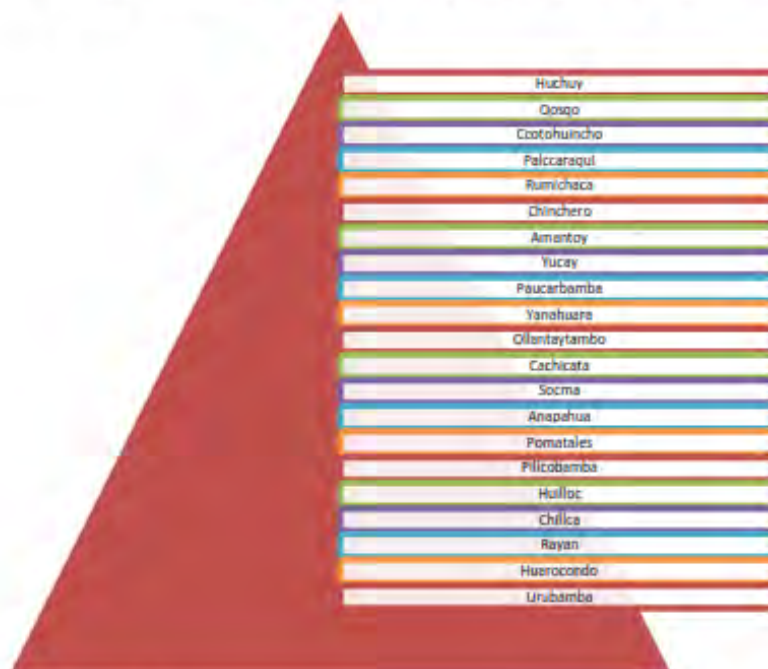
Gráfico N° 1: Comunidades de la provincia de Urubamba

En la actualidad el colegio alberga niños, niñas y adolescentes de 21 comunidades de la provincia de Urubamba: