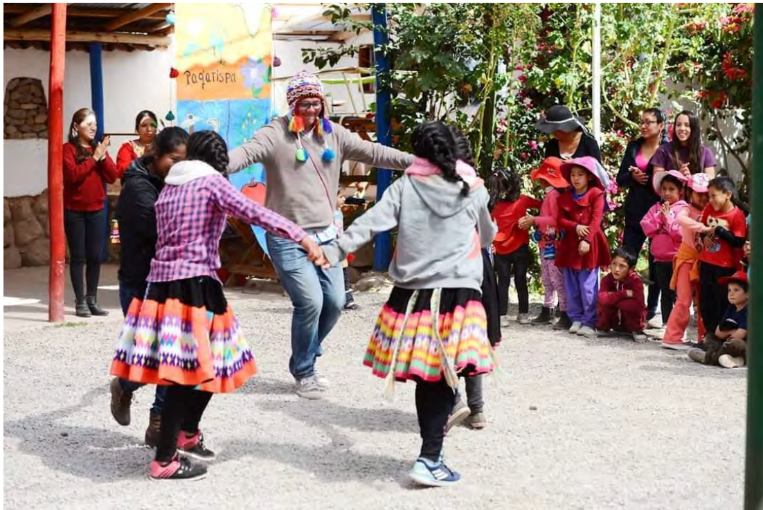
ESTUDIANTES BAILANDO CON SU PROFESOR DE INGLES DE SECUNDARIA EN LA ACTIVIDAD POR LA INTERCULTURALIDAD