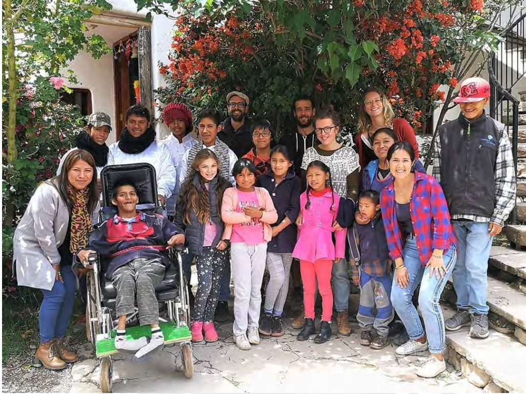
VOLUNTARIOS – PROGRAMA DE INCLUSIÓN PAQARI