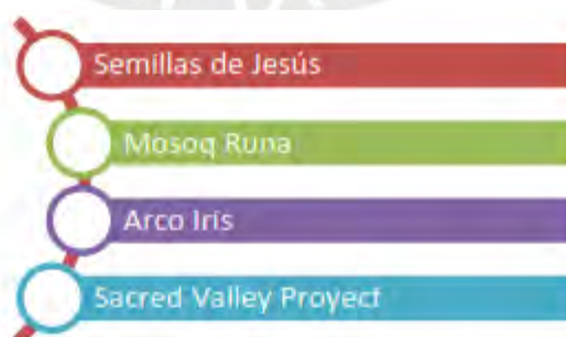
Gráfico N° 2: Casas de acogida en el distrito de Urubamba

Durante los días de semana, los niños, niñas y adolescentes de comunidades alejadas que requieren albergue temporal son acogidos en cuatro casas hogar.