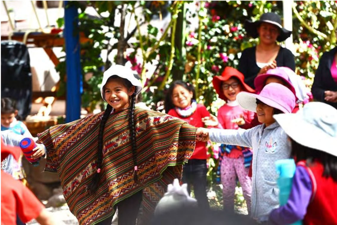
ESTUDIANTES EN LA CLASE DE QUECHUA – 2° GRADO DE PRIMARIA