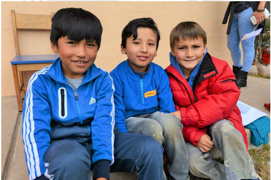
ESTUDIANTES DE 3° GRADO DE PRIMARIA