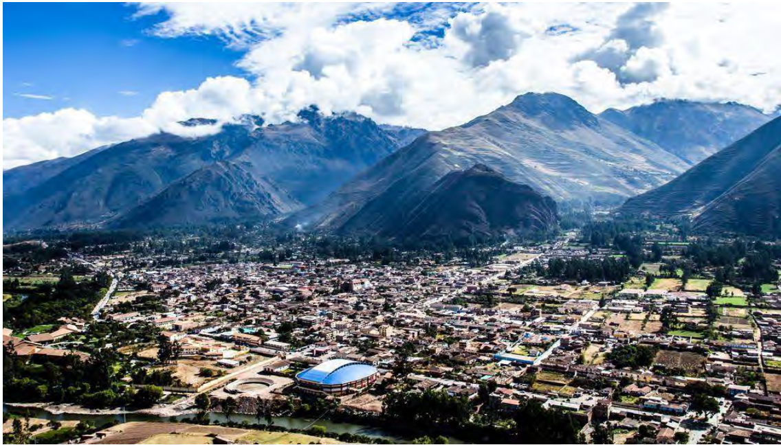
VALLE SAGRADO DE URUBAMBA – CUSCO