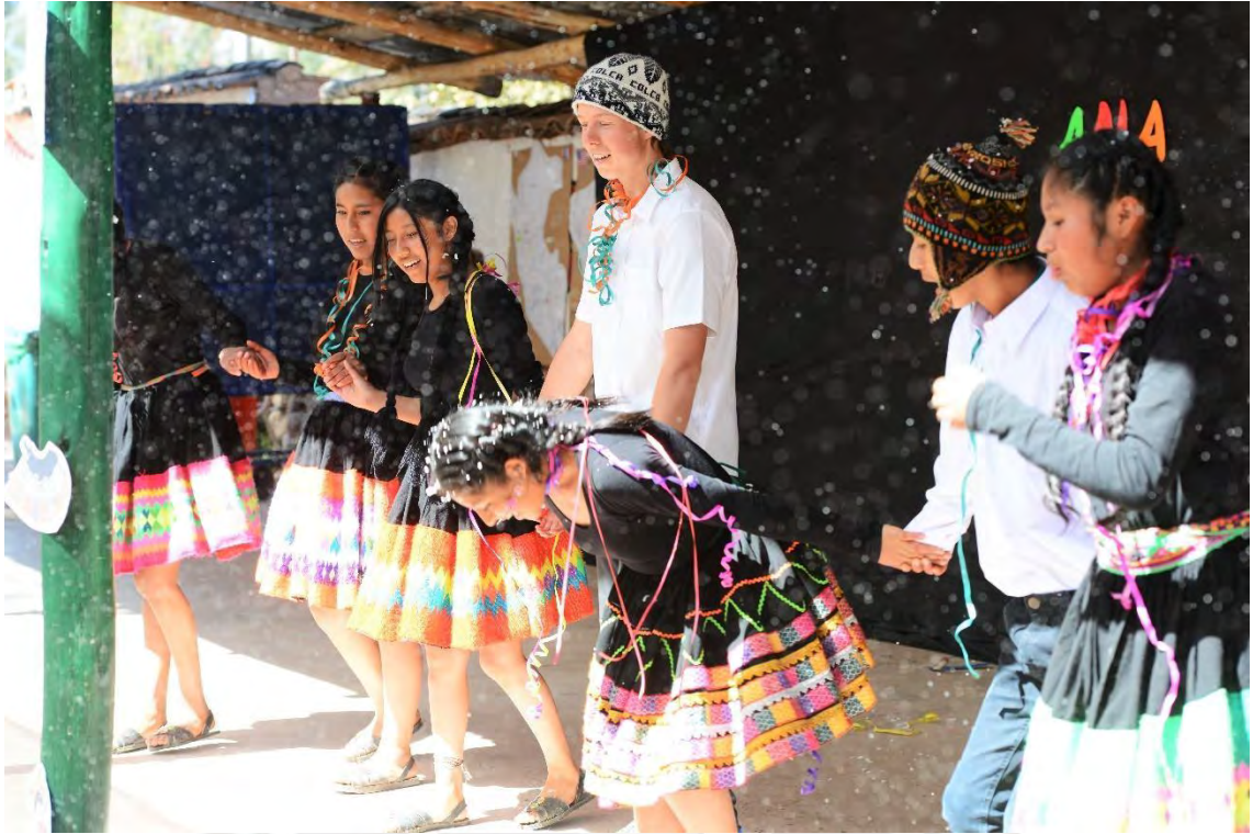
ANIVERSARIO DEL COLEGIO – ESTUDIANTES DE 4° DE SECUNDARIA