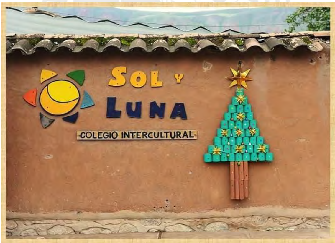
COLEGIO INTERCULTURAL SOL Y LUNA – ESTUDIO DE CAMPO