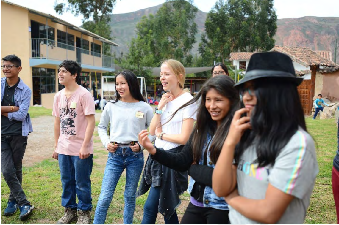
INICIO DEL AÑO ESCOLAR – ESTUDIANTES DE 3° DE SECUNDARIA