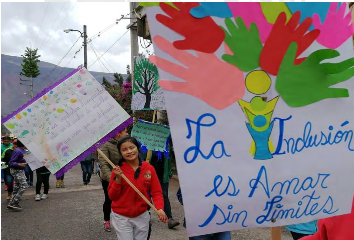
MARCHA POR LA SEMANA DE LA INCLUSIÓN