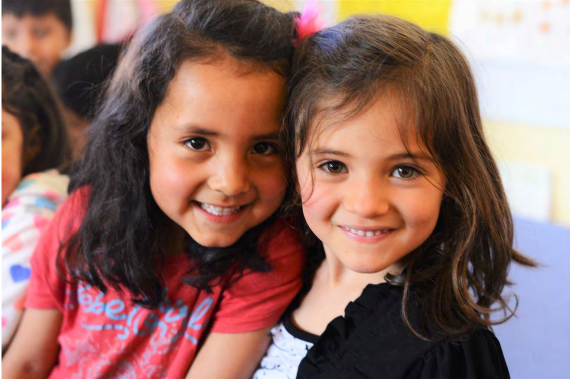
NIVEL INICIAL 4 AÑOS