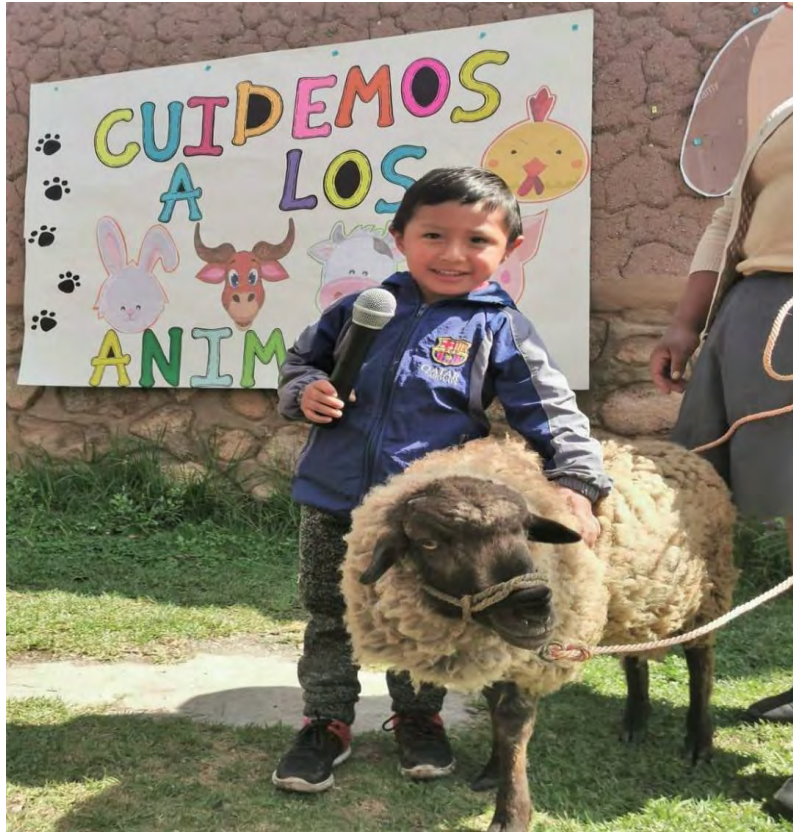
EXPOSICIÓN POR EL DÍA DE LOS ANIMALES