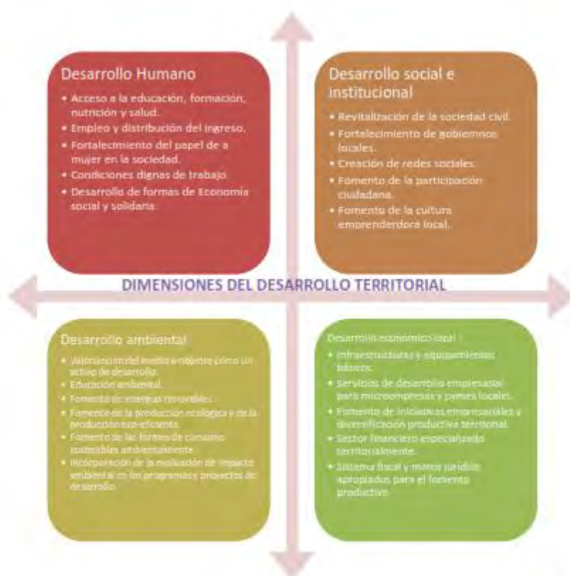
Gráfico N° 4: Dimensiones del Desarrollo Territorial