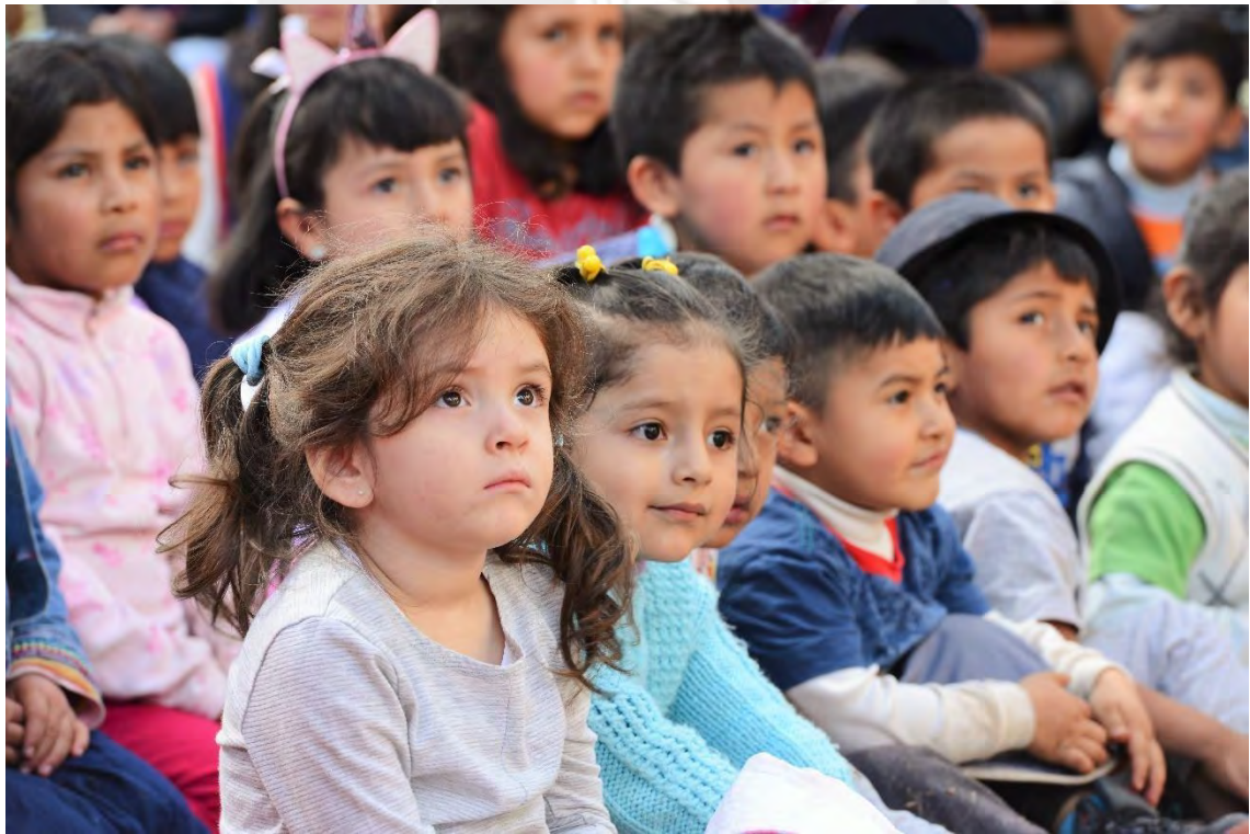
DÍA DE CINE CON LOS NIÑOS DE INICIAL