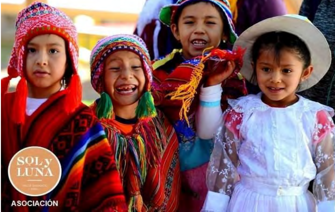
ACTIVIDAD POR FIESTA PATRIAS - ESTUDIANTES DE 1° GRADO DE PRIMARIA