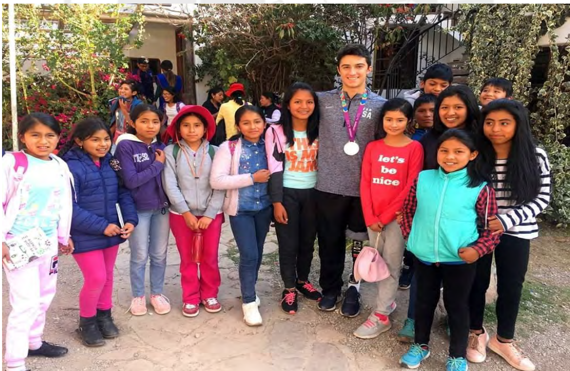
ESTUDIANTES RECIBEN LA VISITA DE UN DEPORTISTA QUE PARTICIPO EN LOS JUEGOS PARA PANAMERICANOS