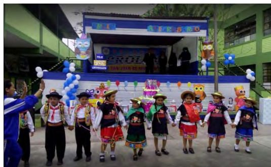
Foto 4. Se muestra un centro educativo en San Juan de Miraflores.

Además, según el reporte anual de la Dirección de la Red de Salud VMT-SJM, en el distrito se cuentan con 29 establecimientos de salud, clasificados de la siguiente forma: