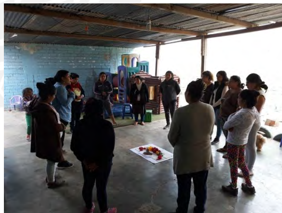
Foto 5. Se muestra un espacio comunitario en San Juan de Miraflores siendo usado.

Así mismo, la municipalidad cuenta con actividades de proyección social que realiza a lo largo del municipio abasteciendo locales que se pueden encontrar en el territorio como: 221 locales para el programa de Vaso de Leche y Complementación Alimentaria, ciento 117 locales para el Programa de Comedores Populares, 103 Clubes de madres. Estos programas suelen ser dirigidos por los mismos habitantes de los lugares con cierta coordinación con las alcaldías. La forma en que trabajan estos programas, en buena parte, es que los asentamientos gestionan un espacio comunal y adaptan condiciones