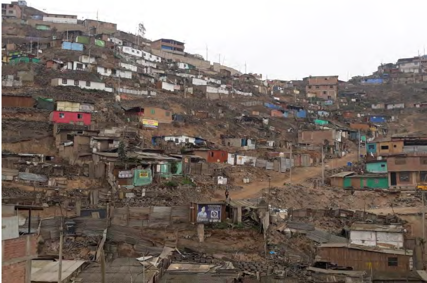
Foto 3. Se muestra la situación de muchas zonas en San Juan de Miraflores.

Así mismo, para el 2012, según el Proyecto de Ciudades Focales (2012), existe un nivel educativo bajo en el 15% de la población.