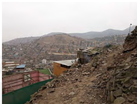
Foto 2. Se muestra la situación de muchas zonas en San Juan de Miraflores.