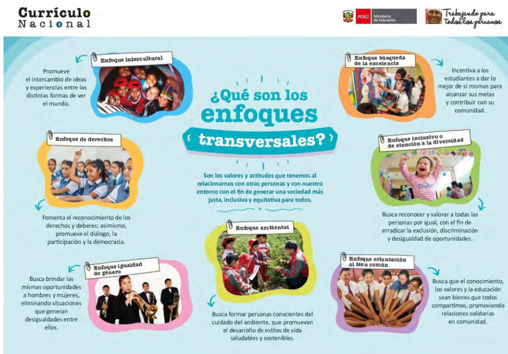
Figura 1: Ministerio de educación (2016).

El enfoque de derechos, según la UNICEF (2018), todos los niños del mundo tiene sin excepción algo en común, son derechos, a una vida saludable, educación de calidad y estar protegidos ante cualquier abuso o violencia. Es más, la misma organización menciona que se debe promover el derecho en las aulas y centros educativos, ya que la práctica de este enfoque, forma un gran impacto en el bienestar del niño y su comunidad educativa. Además, el nivel del cuidado en la primera infancia está enfocado en el desarrollo de un entorno protector que identifica los componentes principales que cuidan el desarrollo integral de los niños, menciona la UNICEF (2018).