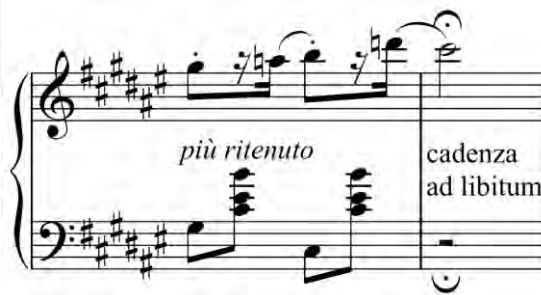
Cadenza ad libitum en la rapsodia Húngara N.2 de Franz Liszt