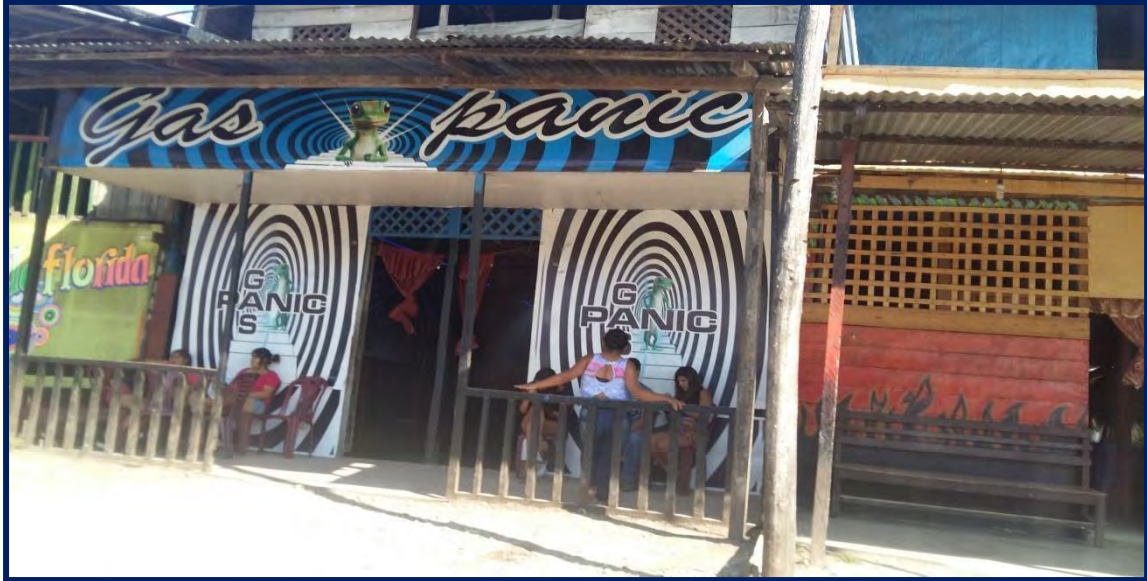
Foto N° 6 Mujeres jóvenes en la puerta de un prostibar

ovalada, como se observan en las fotos N° 6, 7 y 8. Este ovalo constituye el área de concentración de prostibares.