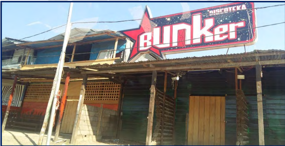
Foto N° 7 Prostibar "Bunker" ubicado en La Pampa periférica ubicado en el área de concentración de bares