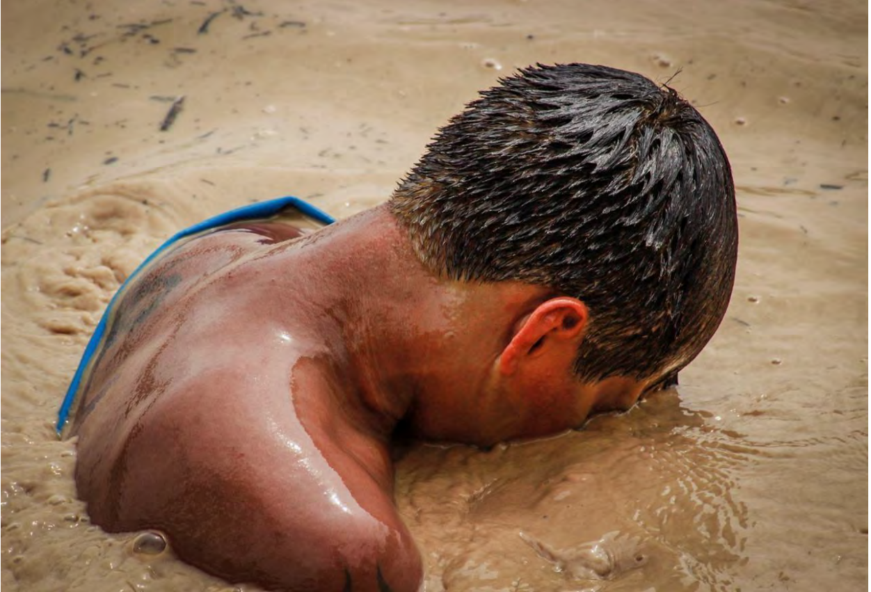
Foto N° 14 Sin ningún equipo de protección, expuesto a aguas contaminadas.