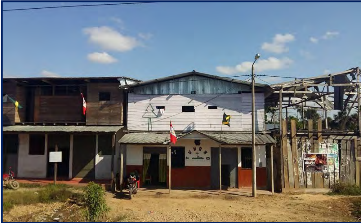
Foto N° 5 Prostibar al pie de la carretera interoceánica- La Pampa periferia

Los bares y prostibares ubicados al frente de la carretera en La Pampa periférica han sido contruidos con madera y plástico. Es importante mencionar que un prostibar es un lugar donde se ofrecen servicios sexuales de mujeres, generalmente jóvenes, y, a la vez, es un espacio donde los asistentes, generalmente, hombres consumen bebidas alcohólicas. Al respecto, en los bares y prostibares hay ambientes donde se vende licor, diferenciándose uno de otro, ya que estos últimos tienen además una serie de ambientes donde se ofrece los servicios sexuales. Así, ambos cumplen una función importante en los procesos de construcción del capital masculino: el ejercicio activo de la sexualidad y el consumo de altas cantidades de alcohol, puesto que ambos son campos de medición y demostración de hombría.