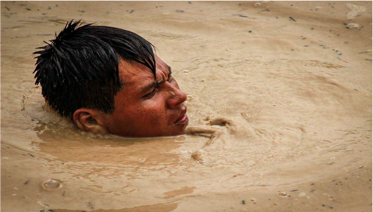
Foto N° 13 Sumergido para mantener la manguera por la que se extrae el oro conectada a la tierra.