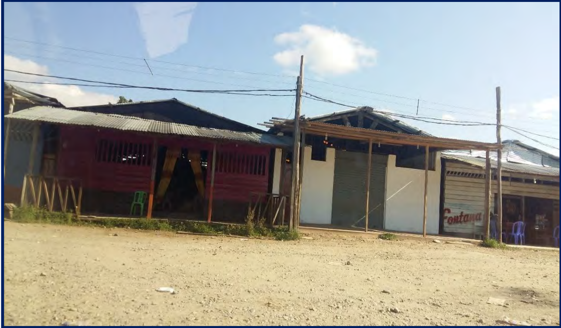
Foto N° 9 Prostibares en La Pampa periférica, en el área de concentración de estos locales

Un dato adicional para tener un panorama un poco más amplio de la Pampa es que la mayoría de la población se desplaza en moto, tanto lineales como en las conocidas mototaxis. Con estos, se transporta pasajeros a lugares aledaños a La Pampa y/o a los campamentos mineros ilegales que están en la zona que denominamos La Pampa, centro productivo, encontrándose el primer campamento a unos 30 minutos del ingreso. Así, a la Pampa centro productivo, denominada así porque allí se concentran los campamentos mineros ilegales, solo se ingresa usando la moto lineal. El campamento minero más cercano a la Pampa periférica se encuentra a 3 km aproximadamente. En la fotografía N° 10 se puede observar un campamento en La Pampa centro productivo, que cuenta con maquinaria muy rústica.