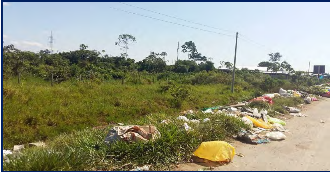
Foto N° 4 Vista del ingreso a La Pampa Periferia - al borde la carretera Interoceánica

peligrosos, reproduciendo el mandato del capital masculino: no mostrar debilidad, dolor, ni temor, ser valiente, arriesgado dentro de un contexto dominado por la criminalidad (asaltos, asesinatos, sicariato, entre otros).