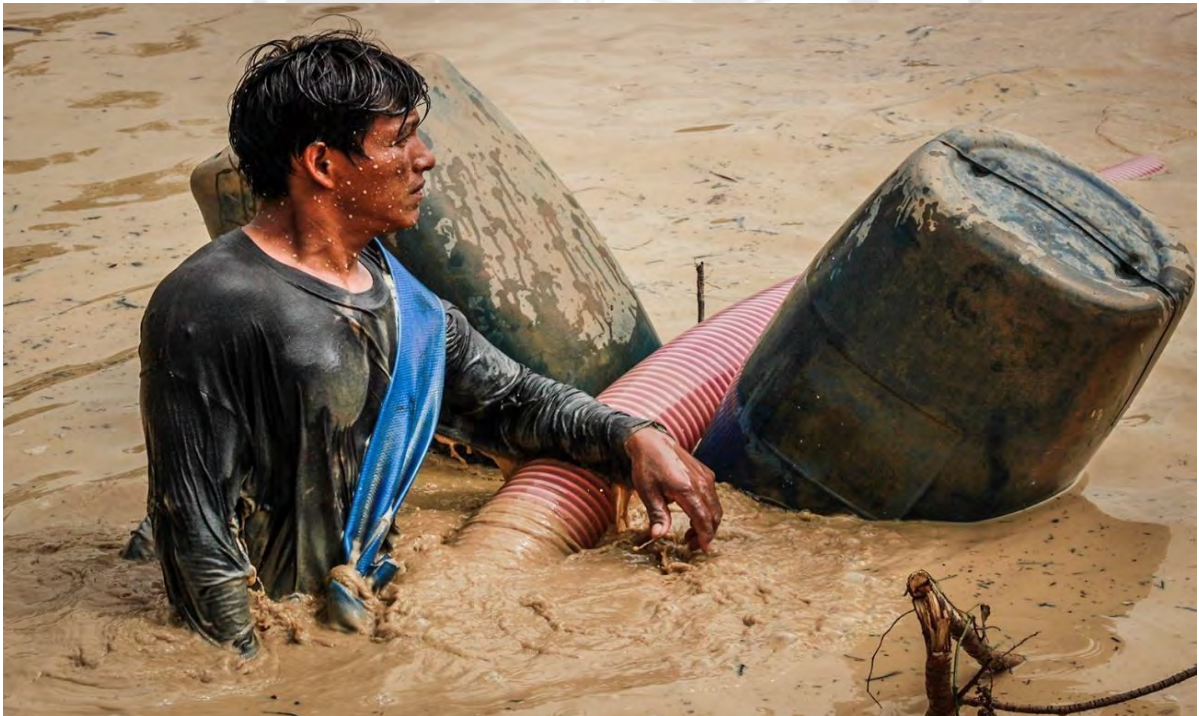
Foto N° 12 Condiciones laborales en las que se trabaja doce horas. Este trabajador debe trabajar seis de ellas sumergido.

“En La Pampa encuentras trabajo donde sea... el alimento te da los días que te toca trabajar, el día que sales también te dan desayuno” (Minero 2, 28 años).