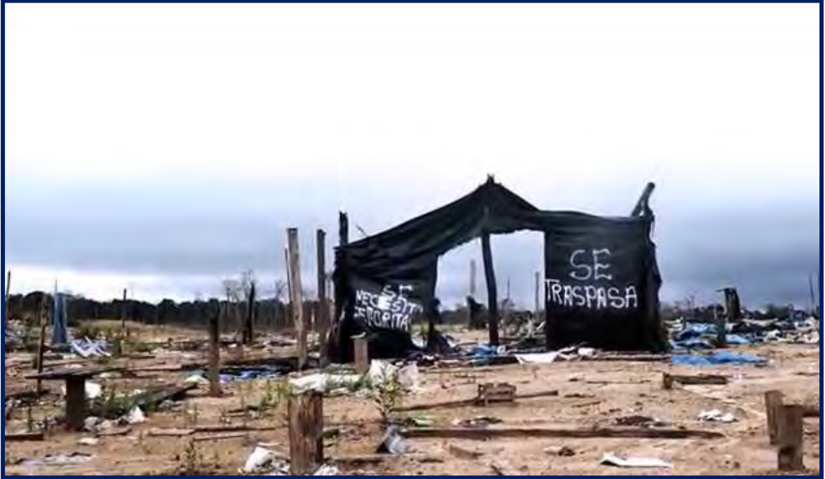
Foto N° 11 La Pampa centro productivo: Bar de un campamento abandonado.