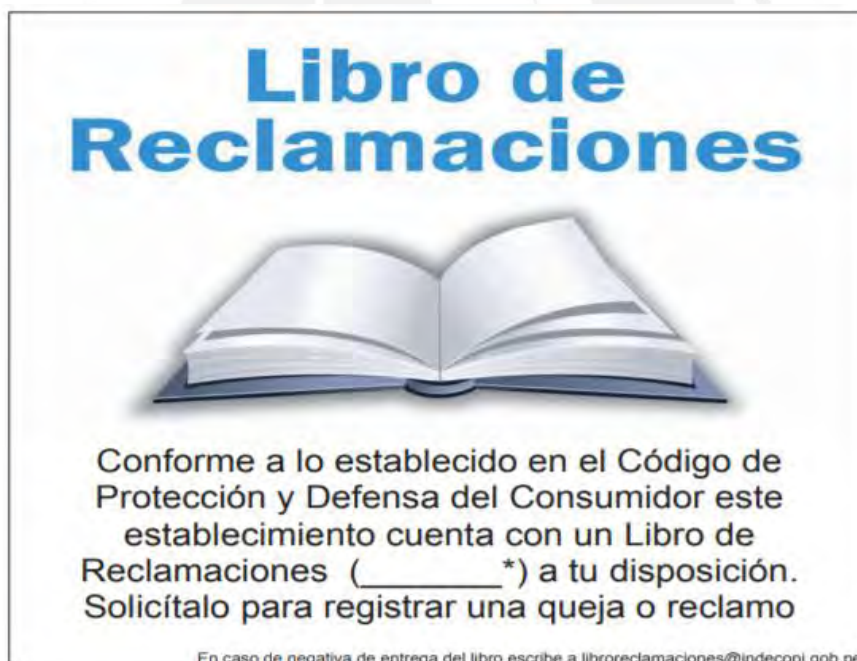
Imagen 1 Aviso del Libro de Reclamaciones

Se precisa que el Aviso del Libro de Reclamaciones deberá tener un tamaño mínimo de una hoja A4. Asimismo, cada una de las letras de la frase "Libro de Reclamaciones" deberá tener un tamaño mínimo de 1x1 centímetros y las letras de la frase "Conforme a lo establecido en el Código de Protección y Defensa del Consumidor este establecimiento cuenta con un Libro de Reclamaciones físico o virtual a tu disposición. Solicítalo para registrar una queja o reclamo." deberá tener un tamaño mínimo de 0.5x0.5 centímetros.