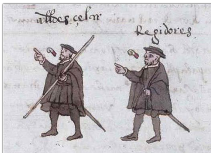
Imagen 3. Detalle de un alcalde y un regidor de cabildo en el manuscrito Pintura del gobernador, alcaldes y regidores de Mexico , ca. 1563-1566, f. 7v 420

Los concejos en el Perú también fueron utilizados para legitimar jurídicamente el acceso al poder y así procurar su ejercicio exclusivo. Dada la extensión del Nuevo Mundo, no era inusual que las villas y ciudades desperdigadas a lo largo del continente americano quedasen en ocasiones aisladas durante prolongados periodos de tiempo de los centros políticos donde estaban asentados los representantes del poder real. Debido a ello, ante la muerte de la autoridad política o militar, el cuestionamiento de las autoridades locales o el apremio de la conquista del territorio, los cabildos asumían la facultad de nombrar interinamente gobernadores, capitanes o justicias, siempre a merced de la confirmación real 421 . Tan temprano como 1510, los expedicionarios del istmo de Panamá se rebelaron contra el bachiller Fernández de Enciso a raíz de una prohibición para rescatar oro con los indios. A través del cabildo de Santa María la Antigua del Darién, sus vecinos nombraron