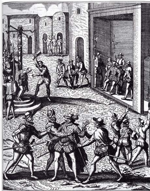
Imagen 2. La captura, juicio y ejecución de Diego De Almagro , obra idealizada de Theodor de Bry, 1600. Apreciarse la ejecución en la picota que aparece al margen izquierdo de la imagen

los cabildos en el Perú para las décadas de 1530 y 1540 es una tarea complicada por la poca documentación sobre este aspecto que se ha conservado en los archivos. Un camino viable es la revisión de los pleitos que se iniciaron en los ayuntamientos y fueron apelados a otras instancias, como la Audiencia de Panamá o el Consejo de Indias. En ellos se deben incluir traslados de los autos hechos en el Perú.