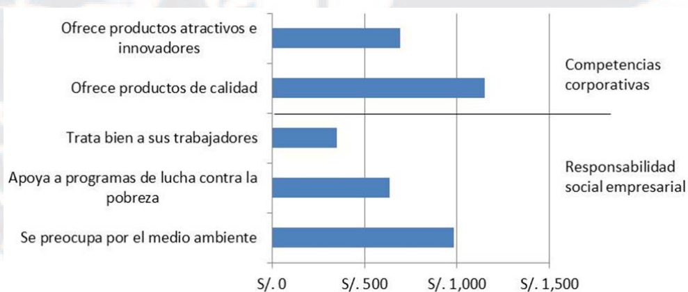
Figura 3. Tasa Marginal de Sustitución de los Atributos.

La Figura 3 muestra la tasa marginal de sustitución de cada uno de los atributos considerados en la elección de laptops estimados sobre los datos de la Tabla 11. Se hace evidente que las acciones de responsabilidad social son características muy positivas para ser ofrecidas al mercado. Otra característica que no debiera ser descuidada es la calidad de los productos.