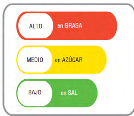
Gráfico N° 3: Semáforo nutricional utilizado en Ecuador