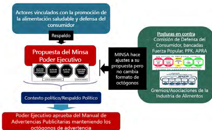
Gráfico N° 9: Hipótesis de la aprobación del Manual de Advertencias Publicitarias

Asimismo, los sectores en contra de la implementación de los octógonos, que era la propuesta central del Manual de Advertencias Publicitarias, realizaron incidencia a favor de sus posturas mediante diversos mecanismos; sin embargo, se mantuvo el modelo octogonal y se impulsó desde el sector Salud su aprobación. Finalmente, esta propuesta del MINSA logró el apoyo político necesario dentro del gobierno del presidente Martín Vizcarra. Esta secuencia y combinación de factores dio como resultado la aprobación del MAP.