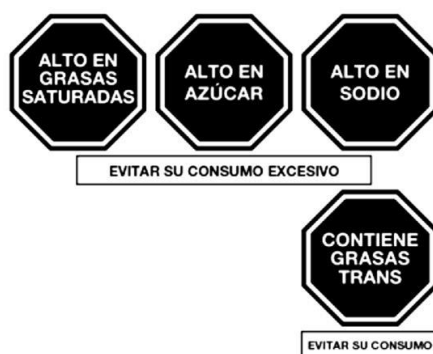
Gráfico N° 7: Advertencias Publicitarias