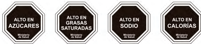
Gráfico N° 4: Etiquetado nutricional frontal de Chile

modificaciones, finalmente este fue el etiquetado que se empezó a implementar en Chile (Ver Gráfico N° 4).