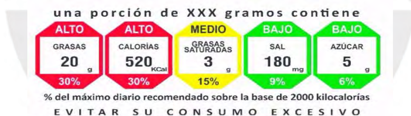
Gráfico N° 8: Propuesta de etiquetado de la Comisión de Defensa del Consumidor

Fuente: Congreso de la República 2017: 64; Guardia 2018a.