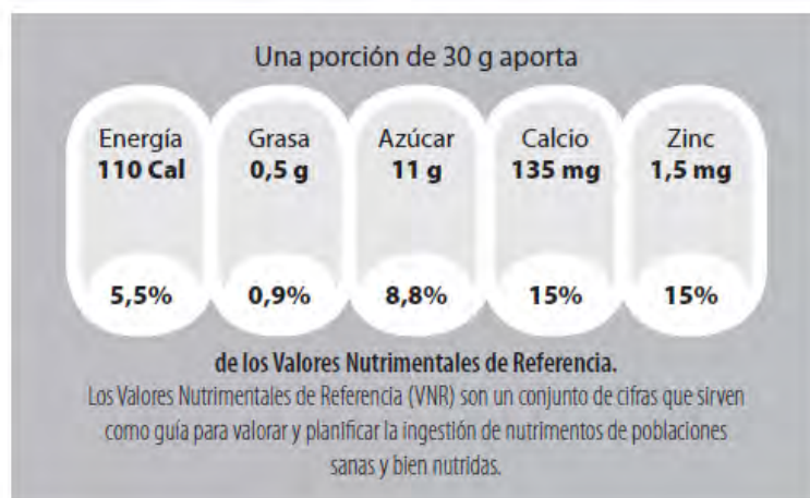
Gráfico N° 1: Modelo de las GDA