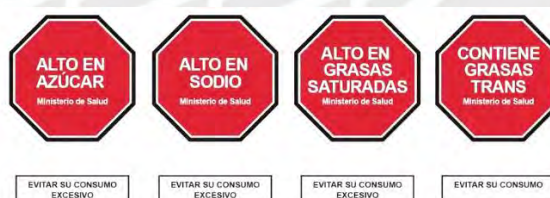
Gráfico N° 6: Propuesta inicial de etiquetado del MINSA