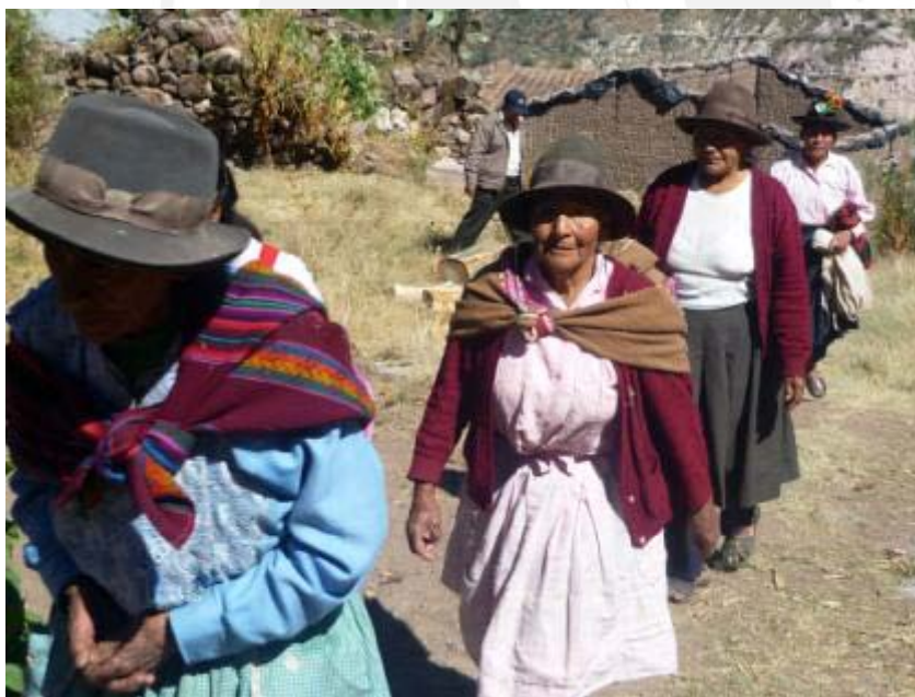
Mujeres de toda edad participaron cargando leña del monte, durante una “leñada” en el 2012, preparando los insumos para la fiesta patronal de la Virgen de Cocharcas.

Sin embargo, tanto los jóvenes, autoridades y líderes de la comunidad entrevistados aportaron datos sobre salvaguardarla dinámica de la reciprocidad o ayni, el valor del trabajo colaborativo comunal y la relación de reciprocidad y solidaridad entre las familias comuneras. La conciencia del comunero, pues todos los son, es de apoyar la labor de uno en beneficio de la comunidad y para ello el poblador debe convocarlos y preparar bebida y comida, y música si es necesario.