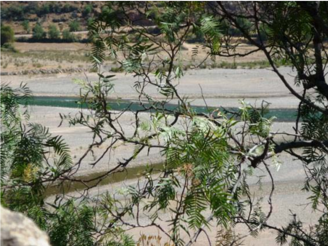
El rio Pampas es un recurso natural y paisajístico importante para el desarrollo.

La necesidad de generar liderazgos especialmente en los jóvenes, de crearles oportunidades para educarse y crear emprendimientos en la comunidad, puede ser un requisito para lograr afianzar el tejido social debilitado que aun necesita reconstruirse. Los jóvenes, con su entusiasmo y su gran aprecio por su comunidad, pueden ayudar también a mejorar la gobernabilidad de la comunidad si se les da oportunidad y se crea un polo de atracción importante para que puedan crecer y desarrollar sus talentos para alcanzar el desarrollo humano, que es fin último de la Gerencia Social.