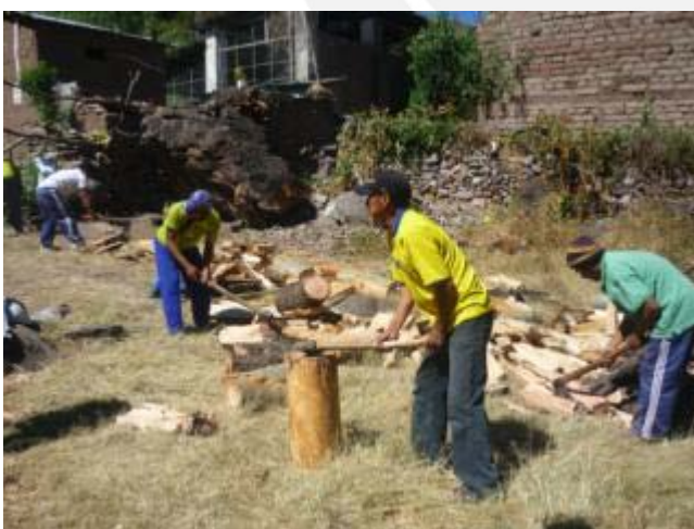
Los varones cortan la leña durante la leñada, jul 2012