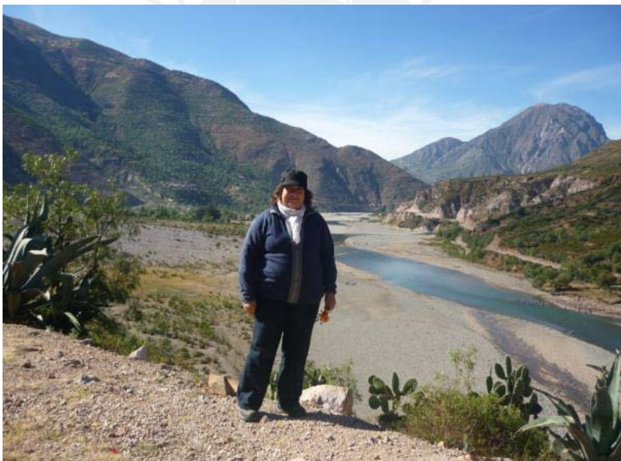
Al fondo a la izquierda, se observa a Huancarucma desde una curva de la trocha carrozable de acceso vial desde Cangallo.

The need to generate youth leadership especially, of their developing opportunities to educate and create community enterprises may be a prerequisite for strengthening the weakened social fabric that needs to be rebuilt. Young people with a torrent of youth, enthusiasm and great appreciation for their community can also help improve the governance of the community if given the opportunity and can also create an environment for them to grow and develop their talents, to achieve the human development which is the ultimate goal of Social Management.