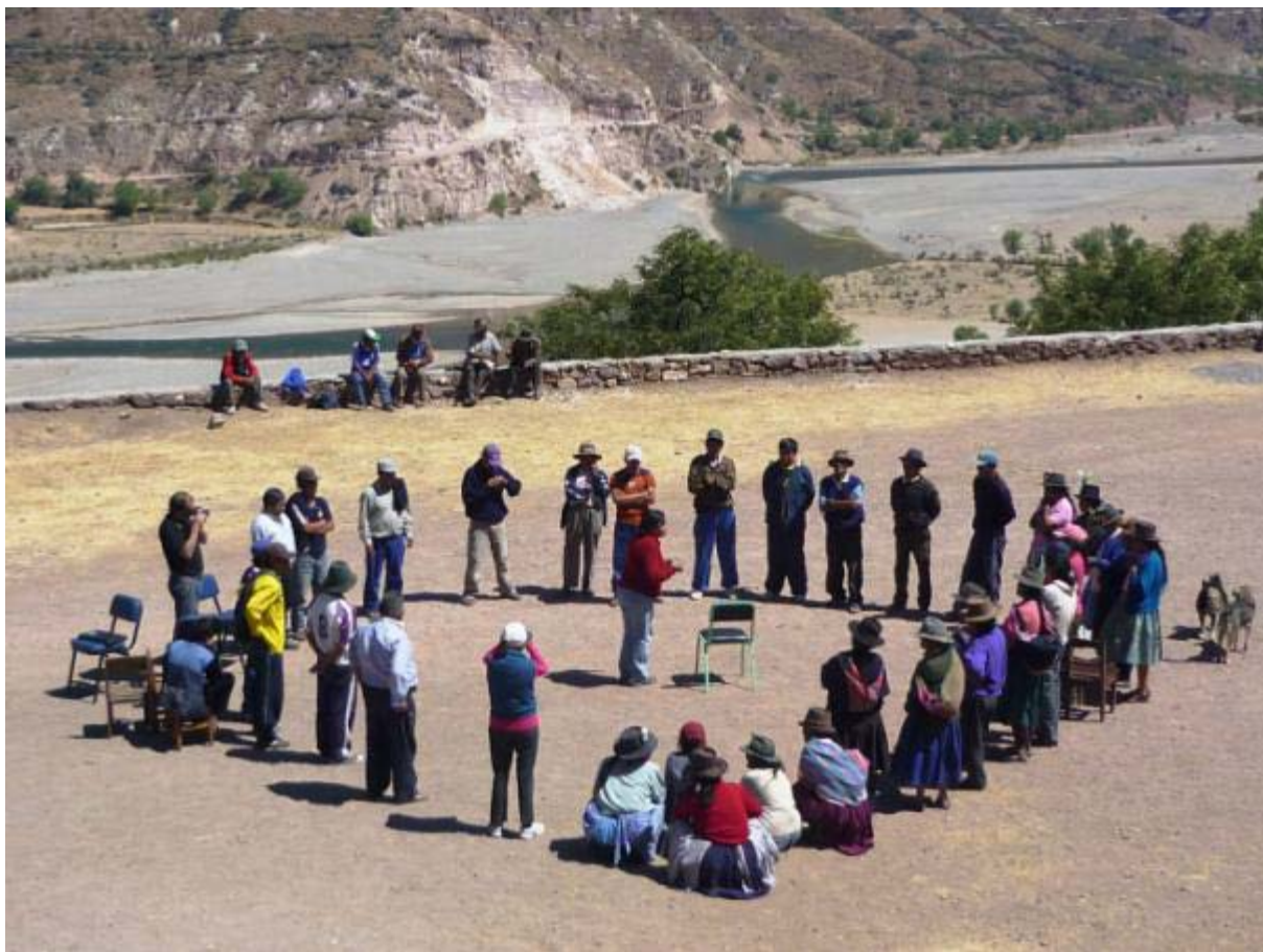
Durante el 1er Taller Participativo para el Desarrollo de Huancarucma, en agosto del 2010, los participantes realizan una dinámica de integración, con apoyo de un equipo de docentes PUCP.