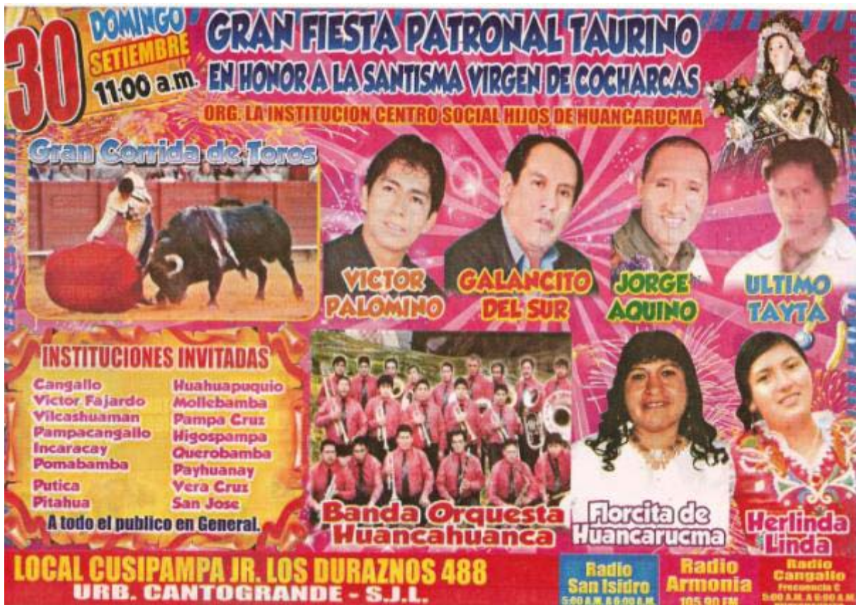
Cartel por la celebración de la Fiesta Patronal huancarucmina en el local de la Asociación de Hijos de Huancarucma en Cantogrande, Lima.

una escuela de escultura y talla en piedra y madera- ha nacido la iniciativa de retomar la costumbre ancestral del trueque de ollas por especies de las comunidades. Existe una iniciativa de instalar una granja avícola y se armó una producción de ollas que fueron bien recibidas por las comunidades quienes intercambiaban estos productos por maíz y granos para alimentar una futura producción avícola en la zona. Otra iniciativa que se ha abierto es la de producción alfarera con la formación de la Asociación de Artesanos de San Marcos, de reciente impulso.