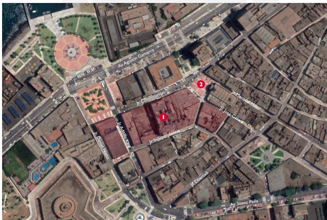
Figura 4. Plano de intervención de Monumental Callao. 1. Casa Ronald. 2. Plaza Matriz. En rojo, área de intervención. Elaboración propia sobre una imagen de Google Earth.

Monumental Callao se ubica en el centro histórico de la provincia constitucional del Callao, dentro de un área que comprende cuatro manzanas cuyos ejes son la Calle Independencia, el Jr. Constitución y el Pasaje Gálvez. Es una zona de valor patrimonial e histórico, considerada intangible, intervenida desde el año 2016 por el proyecto Fugaz, el arte de convivir , una iniciativa artístico-comercial del sector privado, creada con la finalidad de recuperar esta zona de viviendas deterioradas y tugurizadas, inserta dentro de un barrio con un elevado índice de actividad delictiva, cercano al puerto del Callao.