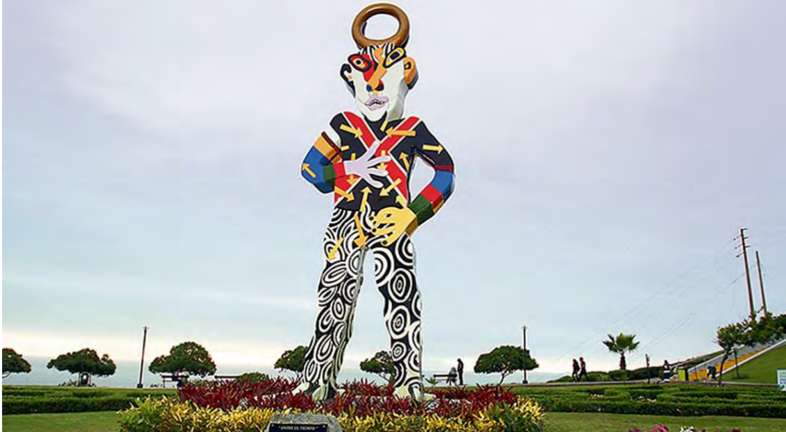
Figura 9. Escultura Entre el Tiempo de José Tola en el Parque del Libro.

El Beso ha dado lugar a que el parque donde se ubica se convierta en un lugar icónico, un locus metropolitano frecuentado por parejas de novios, llamado hoy, debido a eso, Parque del Amor, un espacio urbano que el creador de la escultura define con orgullo como “un espacio para la gente, un espacio para el gran público” (Municipalidad de Miraflores 2016). Entre el tiempo , una colorida escultura bifronte, ha sido rebautizada por los niños, sus frecuentes visitantes y admiradores, como Sol y Luna , en aprecio a su valor estético y lúdico. Ambas esculturas forman parte de un espacio público que, trascendiendo su carácter distrital, se ha constituido en un nodo turístico y peatonal de importancia metropolitana. (GDUMA 2016: 149).