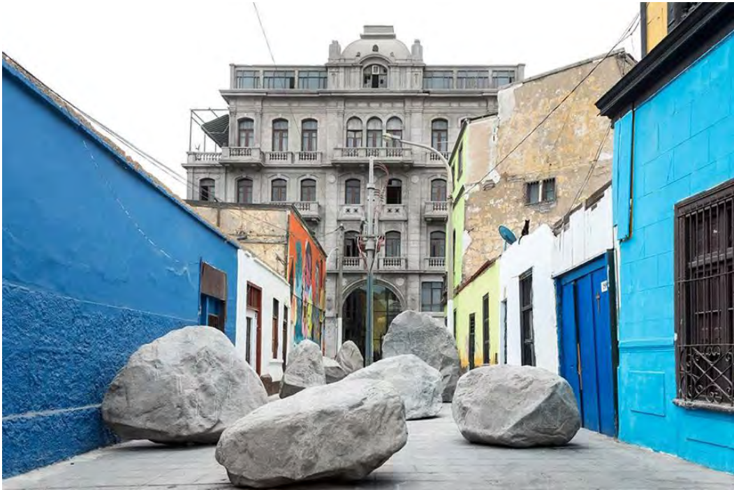
Figura 6. Obra site specific de los hermanos Martinat. Al fondo, el edificio Ronald.

A estas denuncias siguió el alejamiento de varios artistas y empresarios del proyecto y serios cuestionamientos a su accionar y a la escasa integración alcanzada en términos de convivencia con sus vecinos originarios. Se ha dicho que se ha intervenido una zona intangible y se han pintado casas de valor patrimonial vulnerando su identidad histórica (Castillo Dávila 2017). Que no necesariamente 'más arte' significa 'más comunidad' y que en el objetivo de construir comunidad a veces se pierde de vista a costa de qué se consigue (Mitrovic 2017). Que el territorio de Fugaz aparece demarcado por la ornamentación con banderines y azulejos de las calles, cuya presencia/ausencia, señala el límite entre Fugaz y su entorno, que la transformación del espacio se ha dado a través del consumo y su apropiación por los visitantes, sus verdaderos usuarios, que la experiencia urbana de estos se sostiene sobre una narrativa que exalta la confluencia del arte con la marginalidad (Mendoza Bazán 2019). Finalmente, que el modelo de intervención de Fugaz en la zona reproduce el modelo neoliberal, y tiene como consecuencia desarticular el descontento social, la solidaridad de clase y toda forma de confrontar el capitalismo (Eslava Jaime 2019).