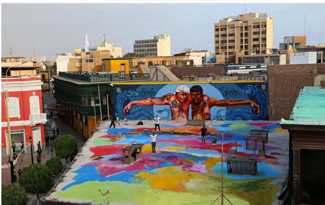
Figura 5. Vista aérea de Monumental Callao con graffiti .

En poco tiempo, de un barrio marginal, Monumental Callao pasó a ser un barrio “trendy”, “cool”, de viejas pero románticas callecitas y una atractiva oferta artística, cultural y de negocios (Echecopar s/f). Un lugar que ofrecía además desarrollo turístico y prometía extender sus beneficios a los vecinos, integrados laboralmente al proyecto, en un ambiente de convivencia y creatividad. La narrativa de Fugaz prometía eso y la realidad parecía confirmarlo. El arte era la piedra de toque del exitoso proyecto (Fugaz | Arte de Convivir s/f)