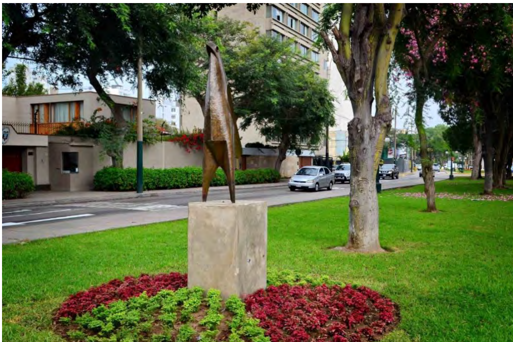
Figura 2. Escultura El pájaro de Oswaldo Guayasamín.

que da a la Av. Parque Gonzáles Prada, el área de la berma permanece libre y no limita el ingreso, por lo que es frecuente observar gente en los jardines, principalmente jóvenes que hacen ejercicio o pasean a sus mascotas; lo cual se ve favorecido por el entorno, ya que esta avenida está en un área netamente residencial, de menor tráfico vehicular.