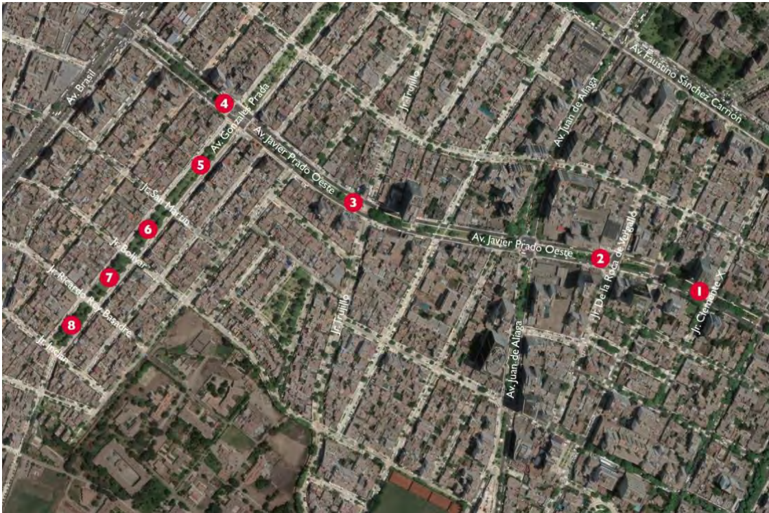
Figura 1. Plano de ubicación de las esculturas del Boulevard de la Cultura de Magdalena del Mar: 1. El Pájaro . 2. Monumento de la Amistad . 3. Toro Negro . 4. La Puerta . 5. El Bailarín . 6. Eco del Agua . 7. Logos . 8. Sin Título . Elaboración propia sobre una imagen de Google Earth.