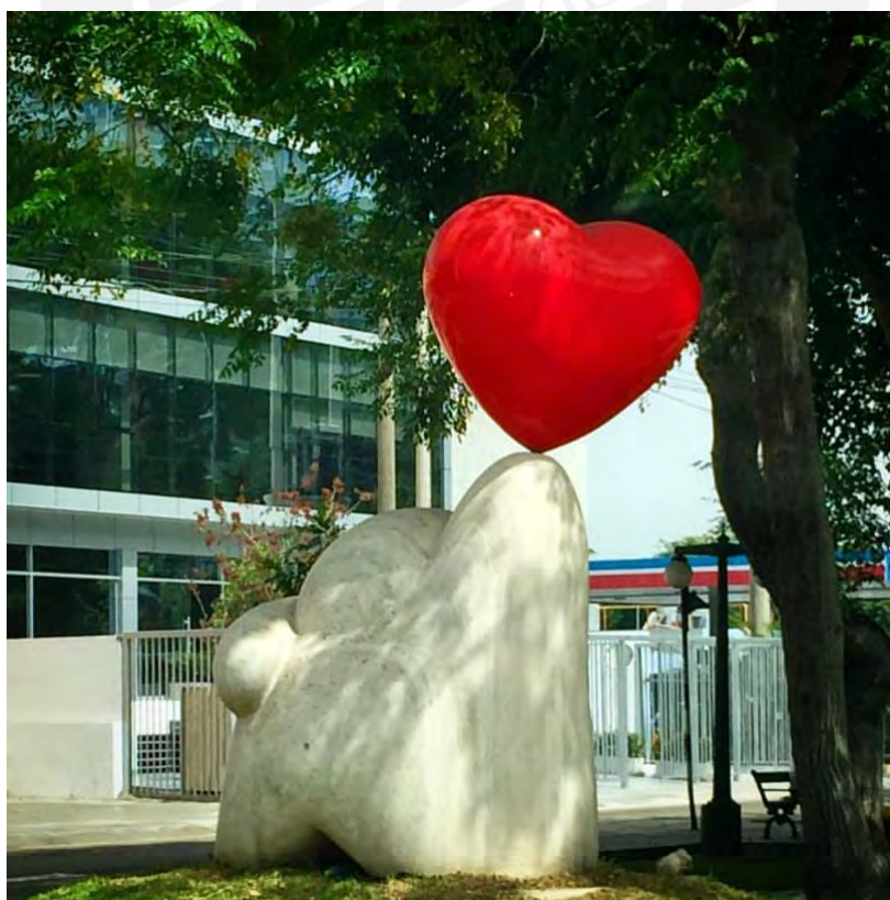
Figura 3. Monumento de la Amistad de Marcelo Wong en el Boulevard de la Cultura.