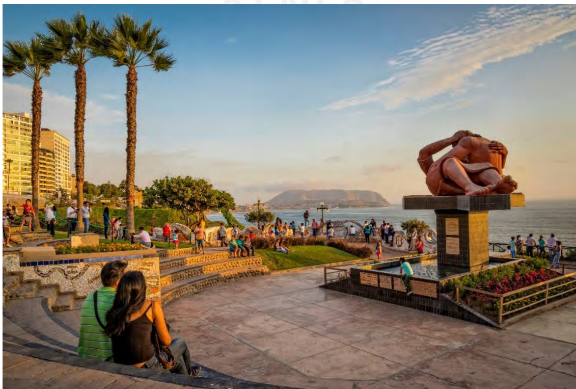
Figura 8. Escultura El Beso de Víctor Delfín en el Parque del Amor.

El conjunto de estas obras configura una suerte de circuito del arte que hoy se encuentra establecido y es promocionado como tal por el Municipio de Miraflores. Sin embargo, la instalación de las obras contemporáneas no fue hecha sin controversia, pese a ser de la autoría de reconocidos artistas plásticos. Dos de estas esculturas, en particular, generaron furiosos ataques y una encendida polémica entre defensores y detractores: El Beso de Delfín y Entre el Tiempo de Tola. (Ochoa 2013) La primera fue considerada por sus detractores como grotesca y ajena a la identidad estética miraflorina. La segunda, monstruosa y kitsch . Lo interesante de esta polémica es el discurso que está detrás y el poder del arte para cambiar la mentalidad de las personas.