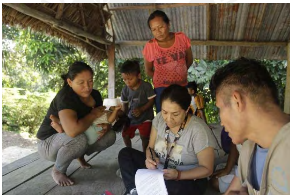
Algunas imágenes de las entrevistas a los Comuneros y Comunereras