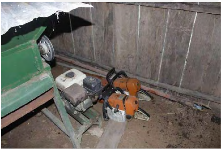
Herramientas/ Equipos de la Comunidad: motores, depósito de gasolina, despulpadora, motosierras