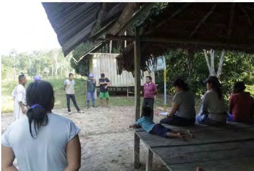
Imágenes del Focus Group con la Comunidad Nativa La Paz de Getarine