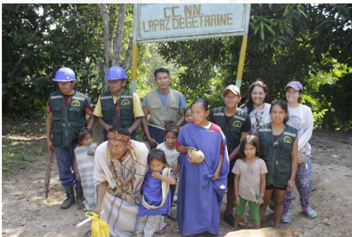
Comité de Seguridad Territorial de la Comunidad Nativa La Paz de Getarine con el Jefe de la Comunidad y su familia, y parte del equipo técnico de investigación