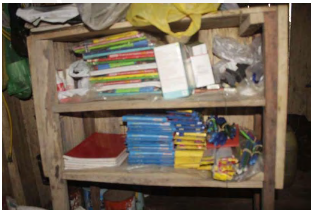
Botiquín Comunal junto con los libros comunales y material educativo