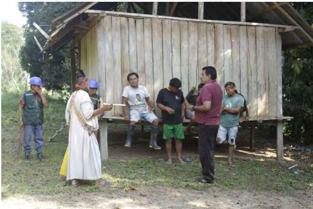
Imágenes de los comuneros de la Comunidad Nativa La Paz de Getarine