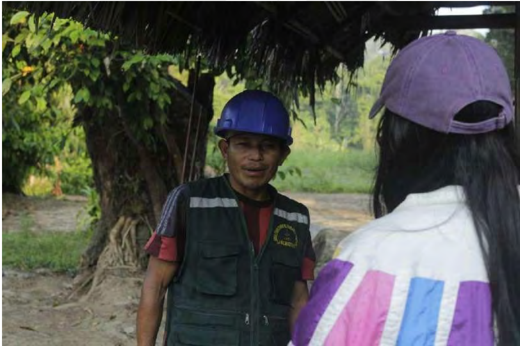
Imágenes de entrevistas a los Comuneros