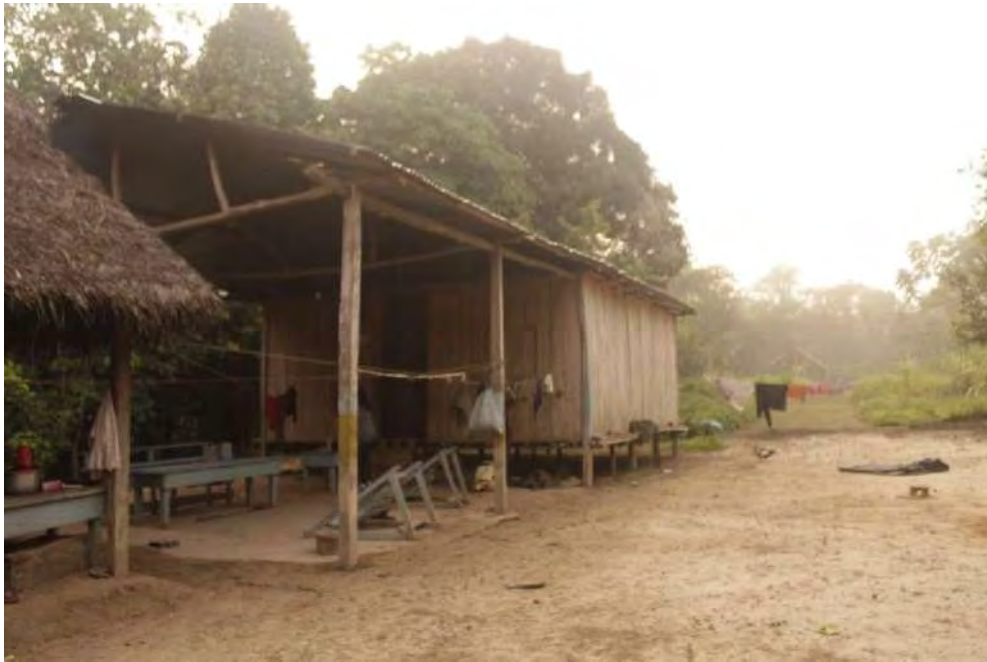
Casa del Jefe de la Comunidad Nativa La Paz de Getarine