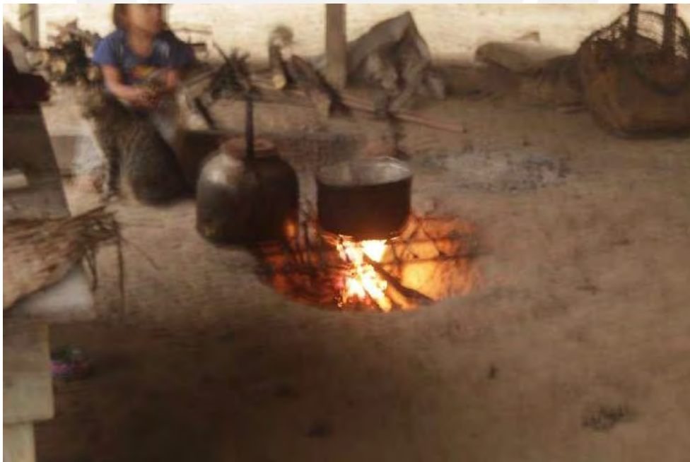
Cocina de barro en la casa del Jefe de la Comunidad La Paz de Getarine