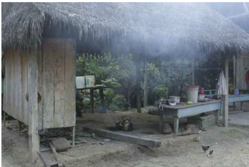
Cocina del Local comunal