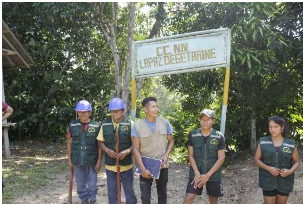
Comité de Seguridad Territorial de la Comunidad Nativa La Paz de Getarine