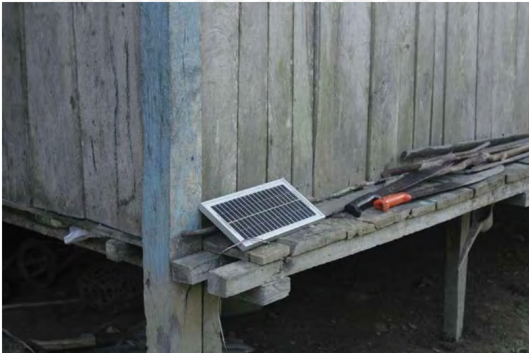
Único panel de energía solar que alimenta a la casa comunal