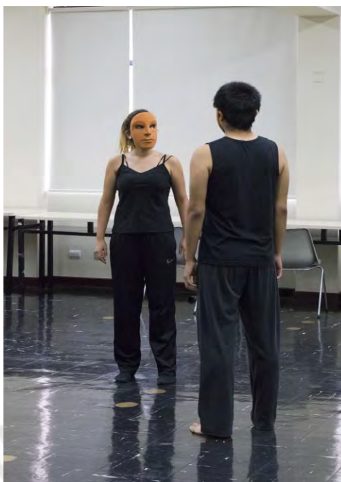
Figura 7. Una pareja realizando el ejercicio “situaciones cotidianas” con la máscara neutra durante la última sesión del primer módulo