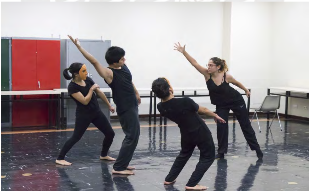
Figura 6. Participantes en el ejercicio grupal le plateau durante la última sesión del primer módulo

Con base en el trabajo corporal observado en la etapa final se considera que los cuatro participantes comprendieron los términos expuestos, pues algunos mostraron mayor precisión y control sobre sí mismos, otros una mayor libertad y fluidez. Por lo anterior no debe entenderse que los participantes lograron una destreza o un control total sobre sus cuerpos, sino que al comparar el trabajo realizado en la primera sesión con este último se evidenció una evolución que permitió la fluidez de los ejercicios, la propuesta constante y la disponibilidad de sus cuerpos, además, sus cuerpos estuvieron alertas y atentos frente a lo acontecido en cada ejercicio.