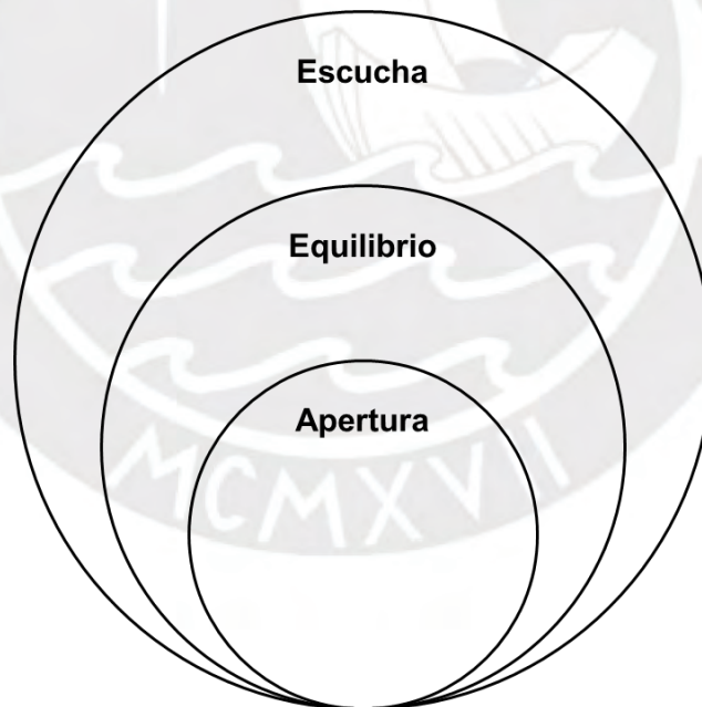
Figura 8. Cuerpo disponible