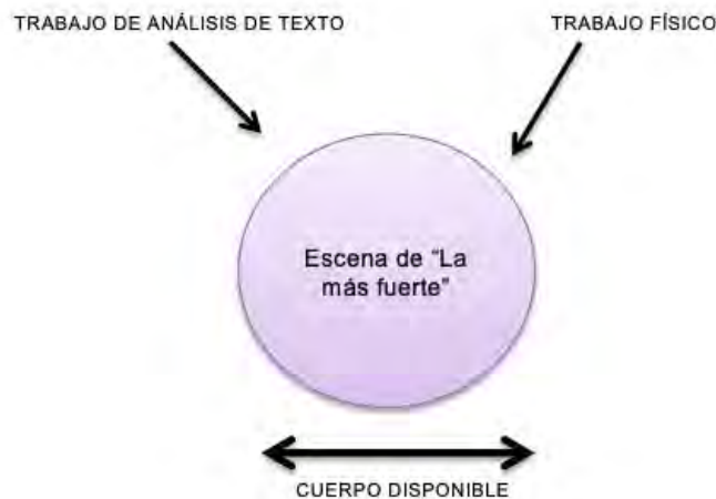
Figura 11. Idea del ejercicio