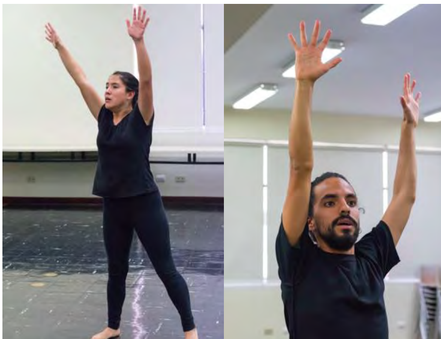
Figura 3. Participantes en el ejercicio “el adiós de los adioses” realizado sin la máscara neutra en mayo