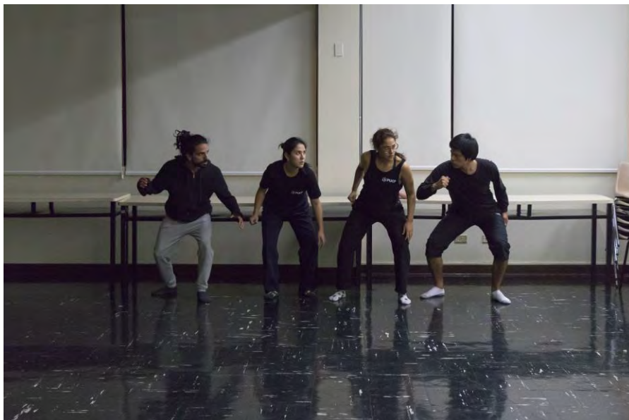
Figura 12. Participantes del laboratorio teatral realizando el ejercicio de “la caza” sin la máscara neutra. Foto tomada durante la sesión 13.