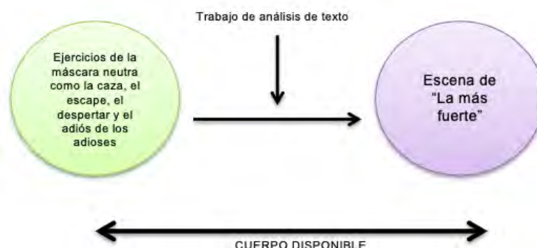
Figura 10. Idea del ejercicio

El ejercicio se explicó de la siguiente manera: el participante debe realizar el ejercicio con la máscara neutra, al finalizarlo levantará la máscara (dejándola encima de su cabeza) e inmediatamente introducirá el fragmento de escena que debe interpretar. Este trabajo permitió integrar los procesos de análisis de texto y trabajo físico, a la vez que posibilitaba el paso gradual de un trabajo con máscara neutra al trabajo sin máscara, siguiendo el entrenamiento en las variables apertura, equilibrio y escucha para obtener la disponibilidad del cuerpo en la interpretación. Es decir, el objetivo requería atender ambos procesos, por ello en los primeros ejercicios se introdujeron oraciones del fragmento asignado, luego de algunas pasadas en los ejercicios y entender la dinámica se abordaron completamente los fragmentos de escena en los ejercicios con la máscara neutra.