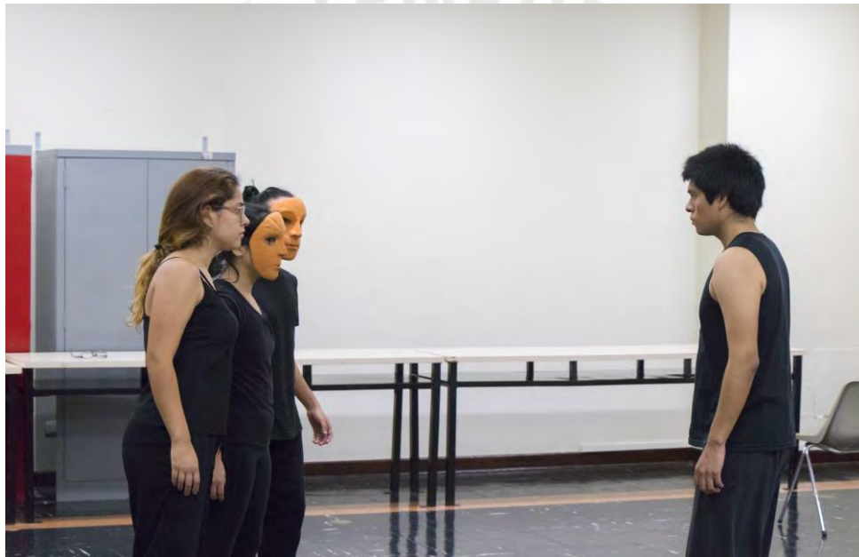
Figura 5. Participantes durante el ejercicio de “ le plateau ” en la sesión 5

“ Le plateau ” fue el único ejercicio grupal que se realizó con la máscara neutra durante el primer módulo, y permitió agrupar y desarrollar la mayoría de los términos trabajados durante este. En el ejercicio se podían adoptar dos posiciones: el líder que debía guiar al grupo y retarlo a escuchar su propuesta para construirla juntos; y acompañar al grupo, donde los participantes debían complementar la propuesta del guía y apoyarse en los demás compañeros para realizarla. El ejercicio brindó un espacio para observar si los participantes habían comprendido todas las variables y términos a través de sus cuerpos, y cómo evolucionaron individual y grupalmente.