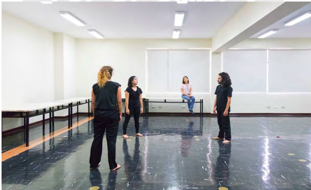
Figura 1. Participantes del primer módulo del laboratorio en las instalaciones de la Pontificia Universidad Católica del Perú

Asimismo, se precisa mencionar que al realizar el módulo los participantes A y C contaban con una experiencia previa de acercamiento (breve) a la máscara neutra; mientras que los participantes B y D no contaban con ninguna experiencia desde la práctica, sin embargo, tenían nociones de la pedagogía de Jacques Lecoq. Las sesiones se llevaron a cabo en las instalaciones de la universidad, en un salón amplio, y como requisito se les solicitó a los participantes asistir con ropa negra, pues así podían darse devoluciones o feedbacks concretos y específicos acerca del trabajo corporal realizado por cada uno.