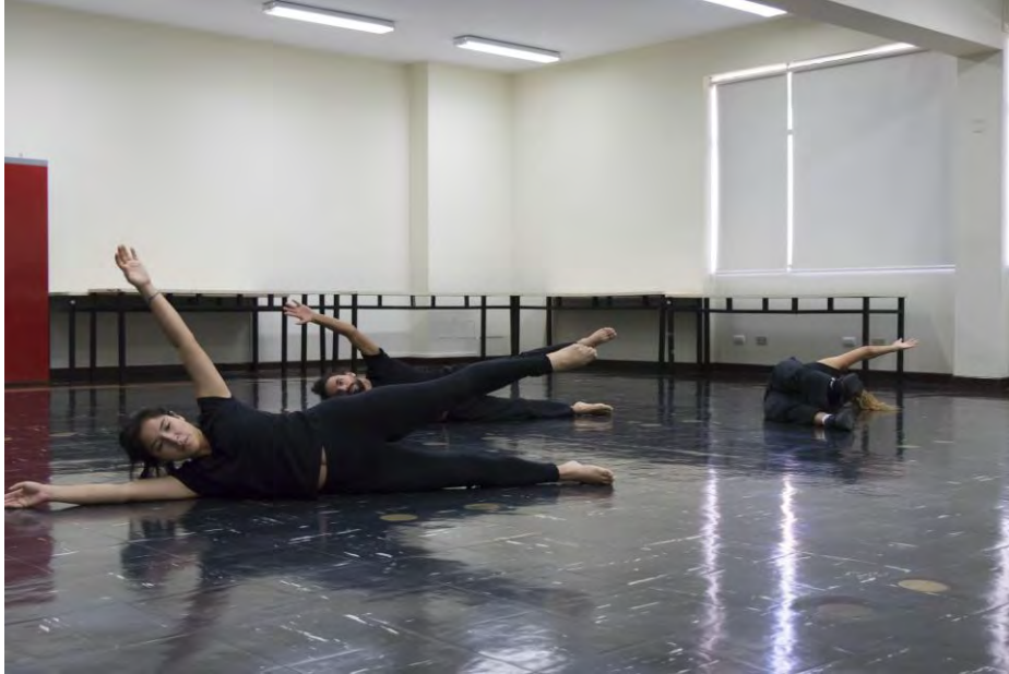
Figura 2. Participantes realizando ejercicios de estiramientos como parte del calentamiento realizado en mayo

un detonante para que los participantes tuvieran mayor determinación y fuerza durante su ejecución.