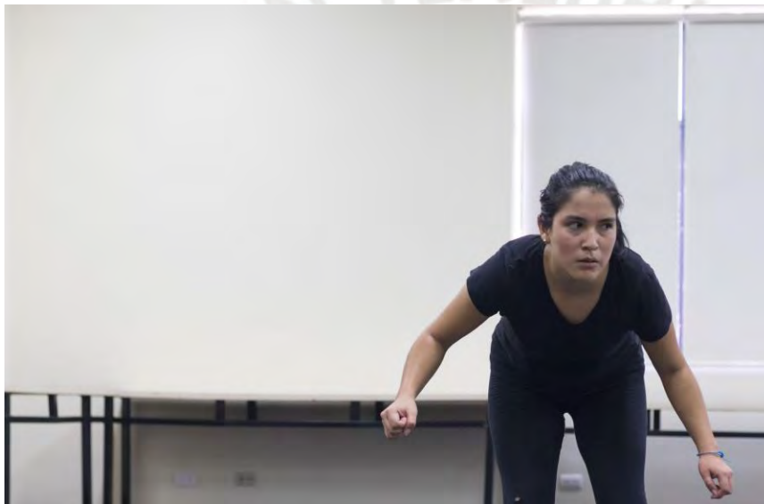
Figura 4. Participante durante el ejercicio de “la caza”, acechando al animal, en la sesión 3

El punto de referencia, la mirada direccionada, fue el eje que les permitió a los participantes conectar con los ejercicios, y posibilitó que cada uno descubriera las particularidades que estos tenían. De igual forma les permitió ser específicos en sus decisiones y/o propuestas, y atender el trabajo de los compañeros para construir juntos el viaje de cada ejercicio. Por otro lado, en esta etapa la respiración les ayudó a los participantes a encontrar la calma durante los ejercicios realizados, lo cual contribuyó a que estos encontraran el proceso de cada pasada y se pusieran de acuerdo para tomar las decisiones en el ejercicio.