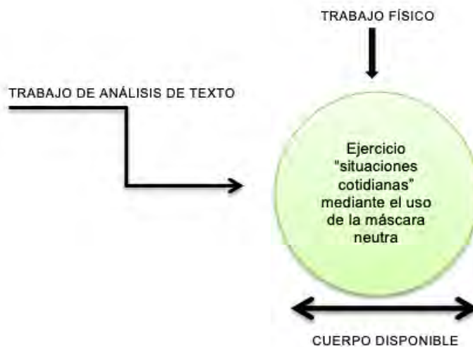
Figura 9. Idea del ejercicio

qué tipo de relación/vínculo manejaron los personajes en esa situación específica, qué características envolvían ese momento en particular, cómo se comportaba el personaje y demás particularidades del momento que exploraron.