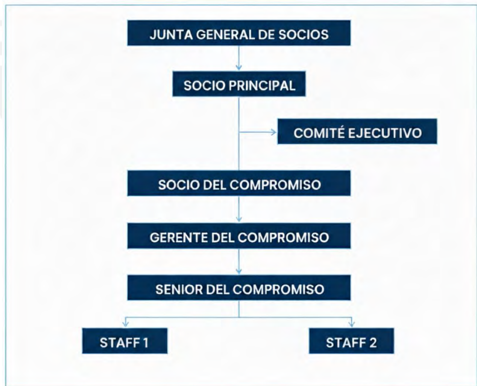
Imagen N°1: Organigrama general

Nota: Información adaptada al desarrollo del compromiso