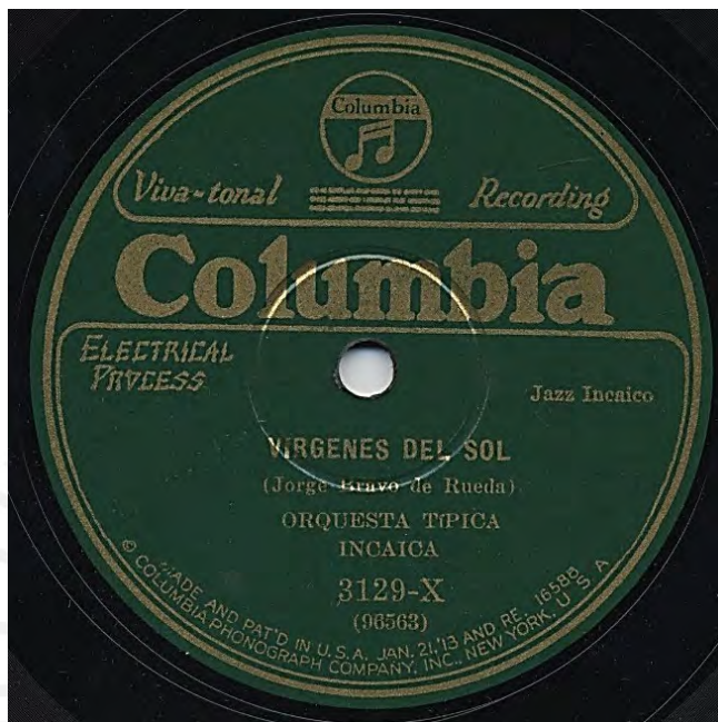
FIGURA 1. DISCO DE VINILO DE VIRGENES DEL SOL. GRABACIÓN DE 1928 POR EL SELLO COLUMBIA.

una nula representación a lo largo de todo el territorio nacional (0.3%)—, es posible determinar que existe un jazz peruano y se explicará el por qué a continuación.