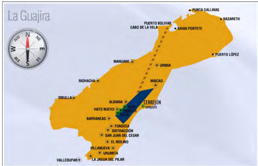
Figura 2 Mapa del cerrejón. La zona azul, al sur de la Guajira es el área de explotación de la mina. En verde, los cuatro pueblos reasentados.

El trabajo de campo se realizó en el municipio de Barrancas en dos periodos distintos, el primero entre julio y agosto de 2018 y 2 semanas en enero de 2019 para realizar una presentación de los resultados preliminares de la investigación a la comunidad. En la primera fase del trabajo de campo (8 semanas), realice visitas a las 3 comunidades anteriormente citadas, participe en 2 reuniones comunitarias (observación participante en un sentido) y realice 25 entrevistas a distintos miembros de la comunidad wayuu, autoridades tradicionales de AACIWUASUG, habitantes no indígenas de Barrancas, así como un a un grupo de académicos conocedores de la cosmovisión wayuu.