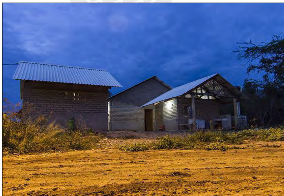
Fotografía 1 Las casas del reasentamiento Tamaquito II.