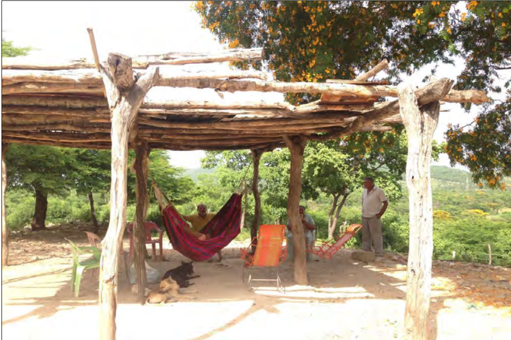
Fotografía 2 Vivienda en el resguardo Zahino.

Actualmente el resguardo está dividido en 5 sectores: Muriatuy, Zahino, Wuiturumana, Zanja Blanca y Guayabito. En este resguardo cada uno de los sectores tiene sus propias autoridades tradicionales, generalmente son un grupo de entre 3 y 7 personas mayores, pueden ser hombres o mujeres, y que se distinguen por su sabiduría y prestigio al interior de la comunidad. El gobernador de cabildo, que representa a todo el resguardo (5 sectores) es elegido cada dos años, rotando la elección entre cada uno de los 5 sectores. Esta manera de estructurar la elección del gobernador fue implantada hace menos de 10 años para evitar los conflictos que se presentaban entre los 5 sectores. Cada sector es libre de elegir el mecanismo participativo para la elección del gobernador, pueden hacerlo mediante el voto público, mediante la