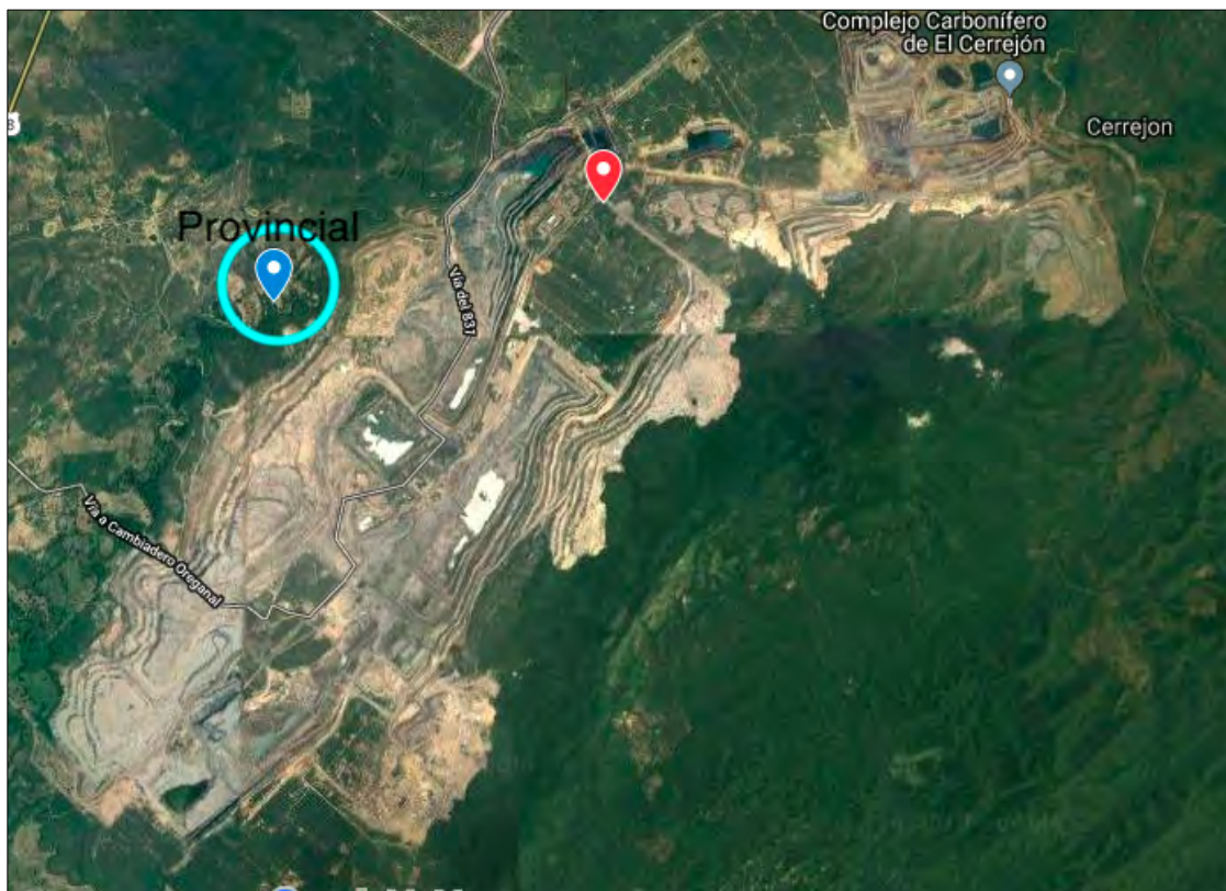
Figura 3 Ubicación del resguardo Provincial. Fuente: elaboración propia en Google maps