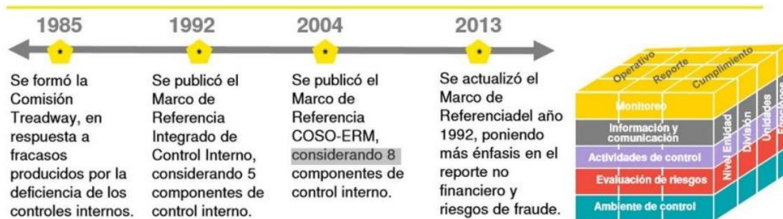
Gráfico 2. Evolución del Marco COSO