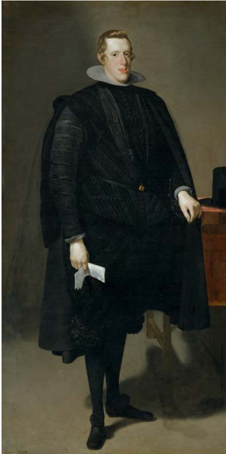
Felipe IV (1623-1627) (figura 1)