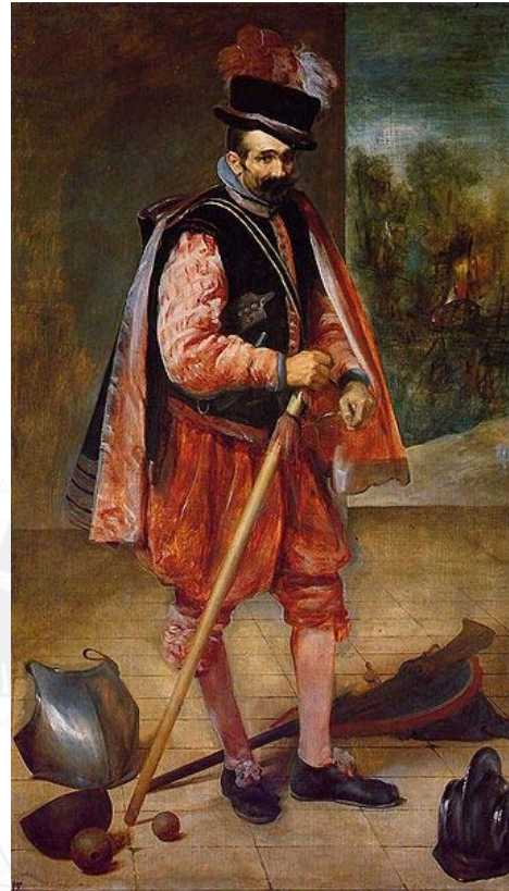
Bufón "Don Juan de Austria" (figura 7)