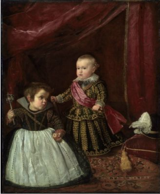
El príncipe Baltasar Carlos con un enano (1631) (figura 4)