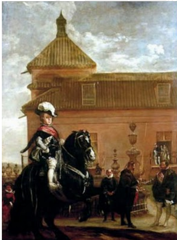
El príncipe Baltasar Carlos en las caballerizas reales (1636) (figura 5)