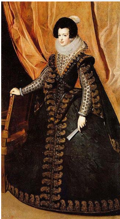
Isabel de Borbón (1632) (figura 13)