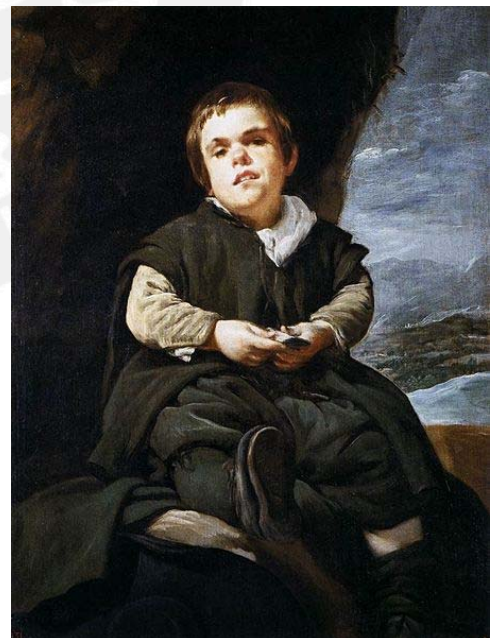
El Niño de Vallecas (Francisco Lezcano "El Vizcaíno") (1635-1645) (figura 11)