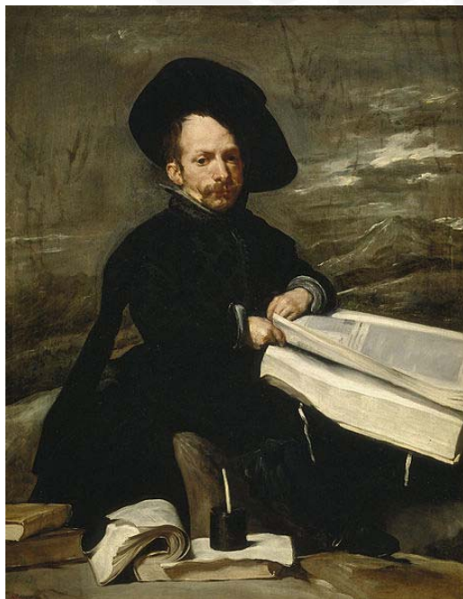
Bufón don Diego de Acedo "El Primo" (¿1644?) (figura 8)