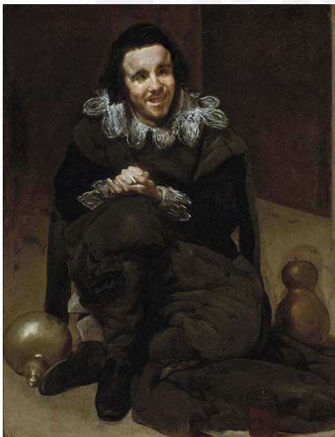
El Bobo de Coria (Bufón Calabacillas llamado erróneamente "Bobo de Coria") (¿1635- 1639?) (figura 10)