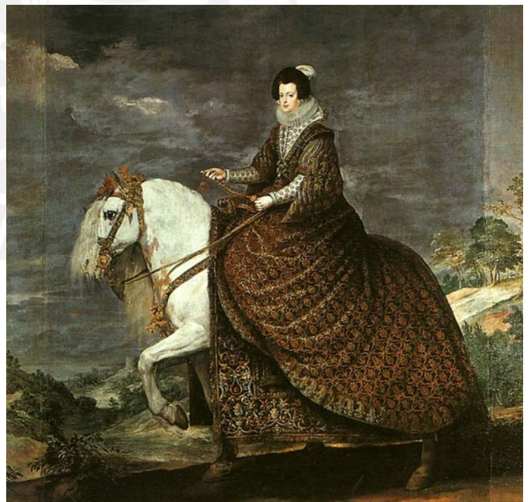
Retrato ecuestre de Isabel de Borbón (1635-1636) (figura 14)