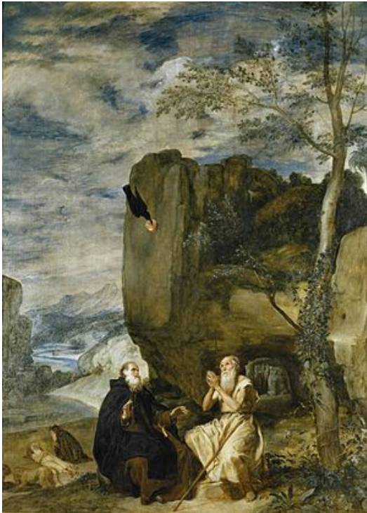
San Antonio Abad y San Pablo, primer ermitaño (1634) (figura 12)