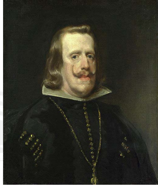
Felipe IV (1656) (figura 2)