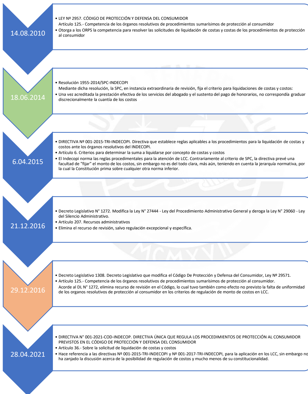
Figura 1. Hitos en liquidación de costas y costos.

A modo de resumen, en el siguiente cuadro es posible observar los acontecimientos normativos y resolutivos de la materia en cuestión, con diferenciación de los puntos de quiebre: el criterio fijado por la Sala Especializada en Protección al Consumidor sobre la inconstitucionalidad de la regulación de costos y la eliminación del recurso de revisión.