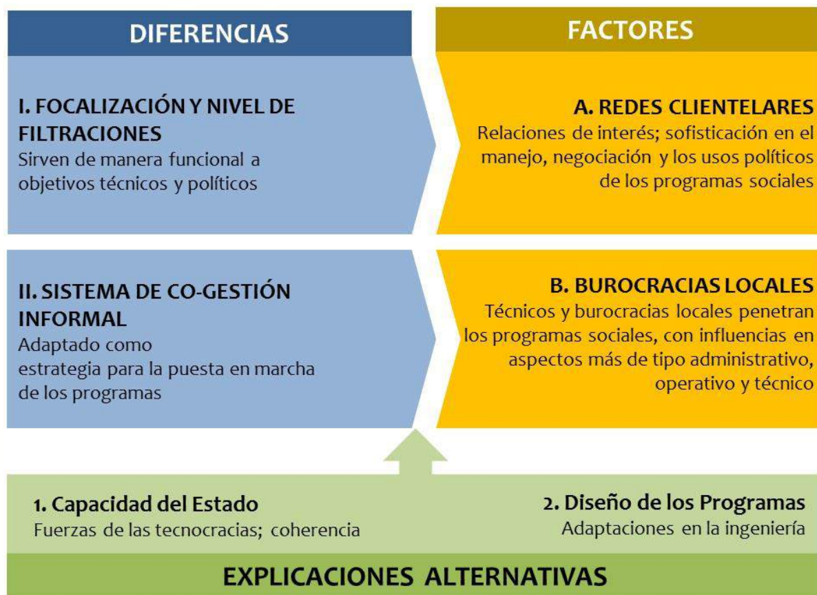
Figura 3. Matriz resumen de la investigación. Diferencias de los programas sociales explicaciones y factores. Colombia y Perú.

Para terminar, en el capítulo séptimo se formulan un conjunto de conclusiones y recomendaciones a partir de los hallazgos encontrados. A continuación, presento la matriz general de la investigación: