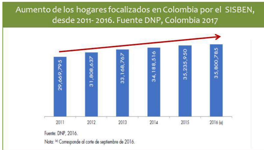
Figura 4. Beneficiarios inscritos en el SISBEN, desde 2011-2016. Fuente DNP