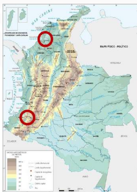
Figura 1. Ubicación geográfica de los municipios de Sincelejo, costa Caribe (circulo superior) y Popayán, zona andina (circulo inferior) en Colombia, 2019.

La visita a campo realizada en septiembre de 2018, al municipio de Sincelejo, permitió corroborar las condiciones precarias con las que se vive en la región; así como las limitaciones logísticas de las autoridades municipales para la implementación del programa. Aunque, destaca el interés y compromiso de las autoridades y representantes sociales de alcanzar los logros definidos por la política pública local, a través del programa FA.