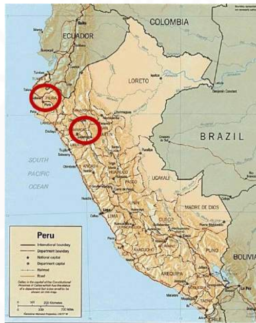
Figura 2. Ubicación geográfica de los municipios de Piura, costa Pacífica (circulo superior) y Cajamarca, zona andina (circulo inferior) en el Perú, 2019.

Gracias a la visita de campo, realizada a fines del 2018, se evidenció el potencial de las entidades locales, la presencia del programa Juntos en los municipios, así como los desafíos que se enfrenta la región debido a problemas climáticos. Ejemplo de esto, fue el niño costero que afectó en 2017 los avances en materia de reducción de la pobreza local. Tomando en consideración las reuniones sostenidas con los responsables territoriales del programa Juntos en Piura, así como encuentros con las entidades locales, se recogió material valioso de análisis que fue incorporado, a lo largo de los capítulos.