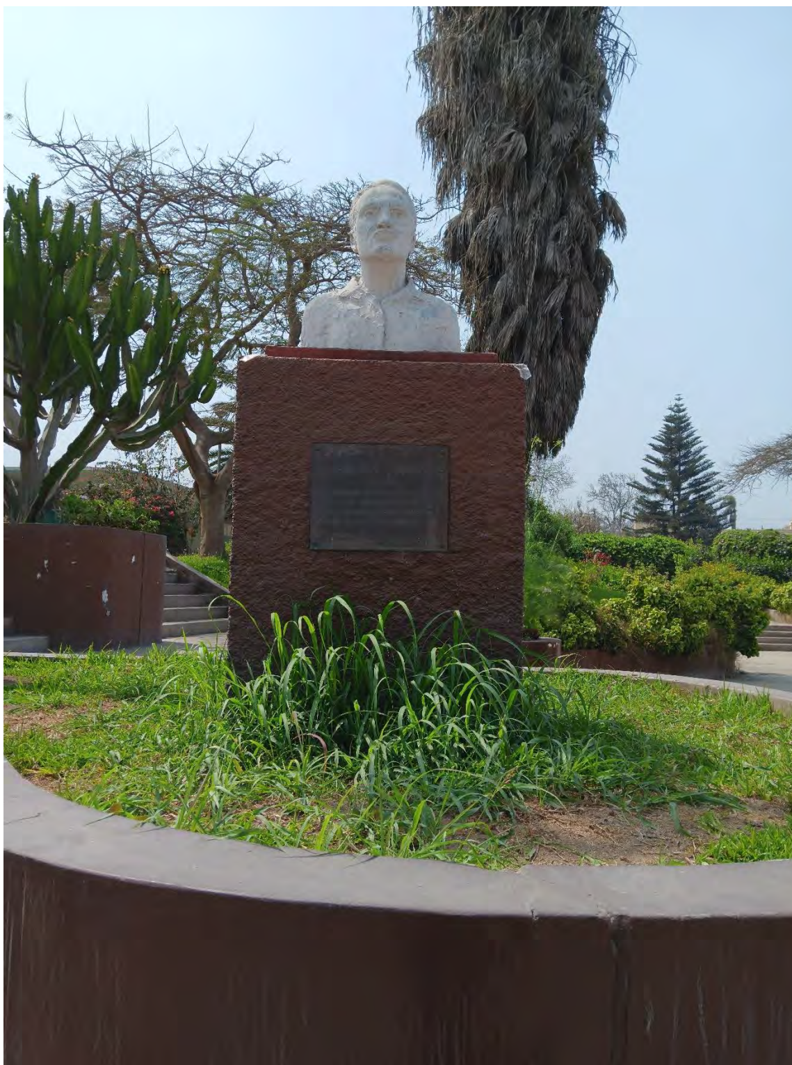
Busto en el Paraninfo de la UNALM