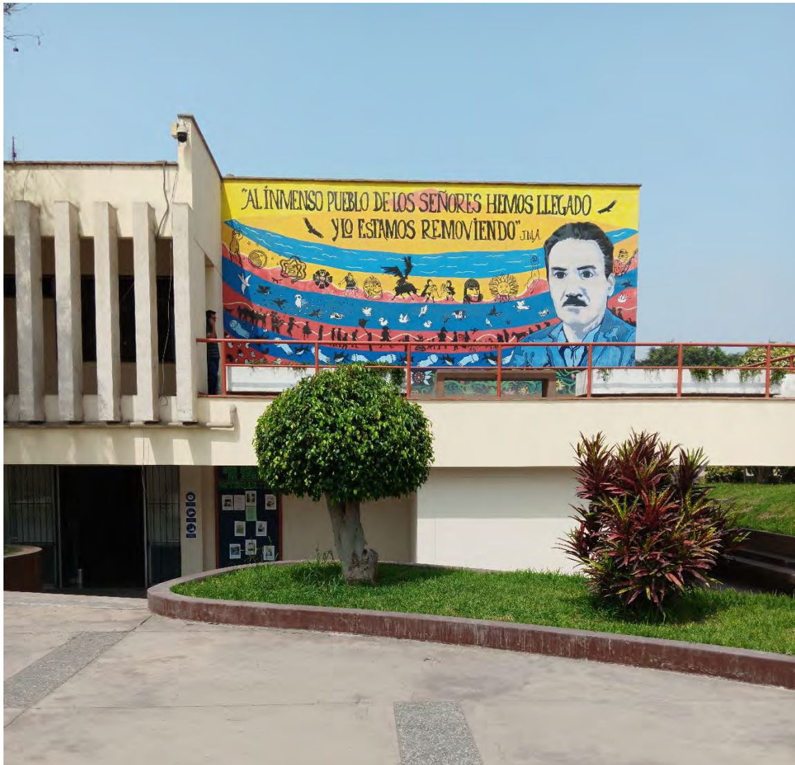
Mural en el comedor universitario UNALM