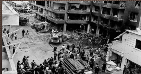
Calle Tarata, Lima (1992)