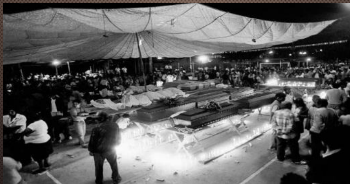
Región Junín, 1993