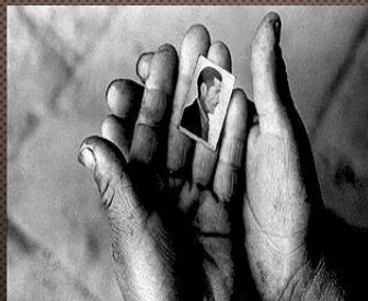
Mujer muestra la foto de un familiar, Ayacucho (1984)