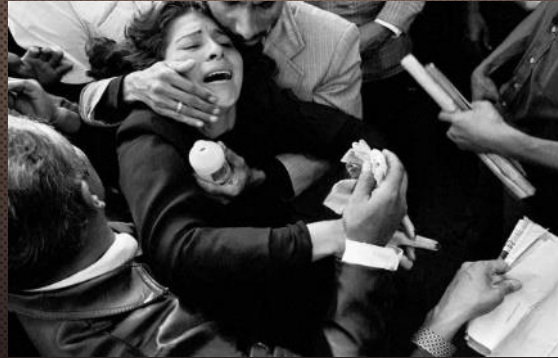
Cerro de Pasco, Pasco (1983)