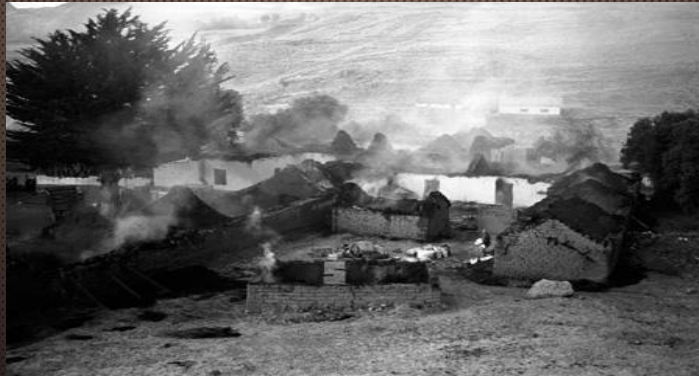
Quisuni, Orurillo, Puno (1989)