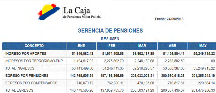
Figura 1: Ingresos por aportes y egresos por pensiones de La Caja

Una justificación objetiva de por qué es importante este trabajo de investigación radica en que, desde la creación de La Caja, sus recursos han venido desapareciendo; se gasta más en el pago de pensiones de lo que se obtiene por ingresos e inversiones; esto se debe a que los aportes al Fondo Previsional no pueden solventar un régimen previsional de las características que presenta la Ley de Pensiones de La Caja (Decreto Ley N° 19846). Con el fin de ilustrar esta problemática, se presentan unos datos publicados en su portal institucional 1 :