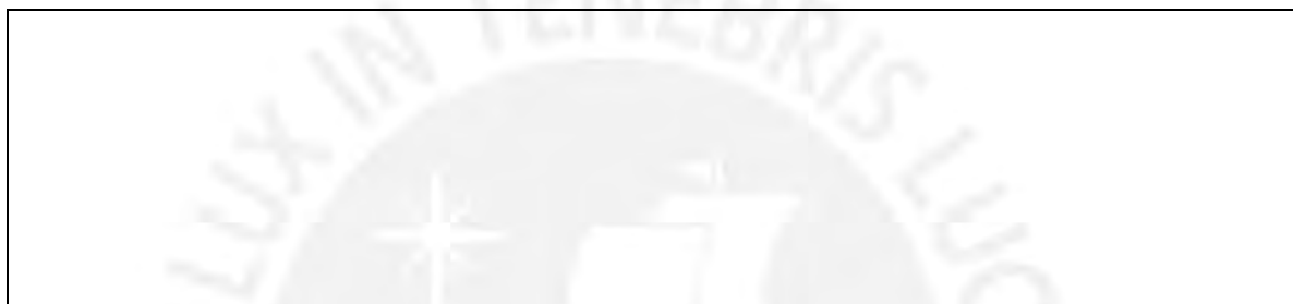
Diagrama de la disposición y apropiación del espacio por parte de los profesores y asistentes al taller: