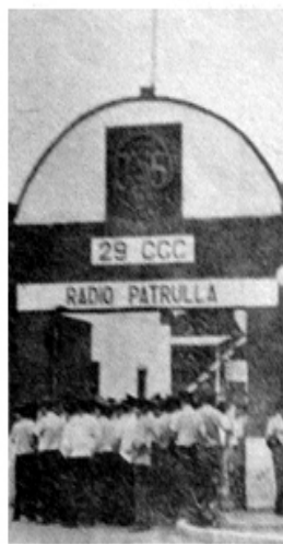
Policías, un problema atendible. A la derecha, un tanque del Ejército. El orden público pudo ser restablecido cuando unidades militares motorizadas suplieron el vacío policial de la ciudad.