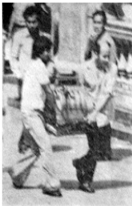
Asaltantes cargan con una caja registrada. A la derecha, arde el Centro Cívico. "Aterra —dice Mario Vargas— que apenas desaparece la policía, millares de peruanos están dispuestos a robar y saquear".