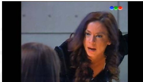
Figura 4: Capítulo 93 “La Verdadera Naturaleza del Amor” Casi Ángeles 2013 4

Finalmente, en el capítulo 65 de la cuarta temporada, “La tragedia de Romeo y Julieta” cuando Luz grita a Marianella por haberla encontrado acostándose con un salvaje, vemos planos ligeramente contrapicados que engrandecen a Luz (antagonista) contribuyendo a que a sus gritos se sientan más fuertes, por lo que los espectadores pueden sentir cierto rechazo hacia el personaje. Algo interesante también es que, en el encuadre, Luz siempre aparece ligeramente más arriba del otro personaje, resaltando su poder o grandeza. De esta manera, se puede fortalecer también la figura de poder y autoridad de este personaje, resaltando su maldad (Guía de observación capítulo 65 cuarta temporada). Se puede observar mejor en el siguiente pantallazo de la toma: