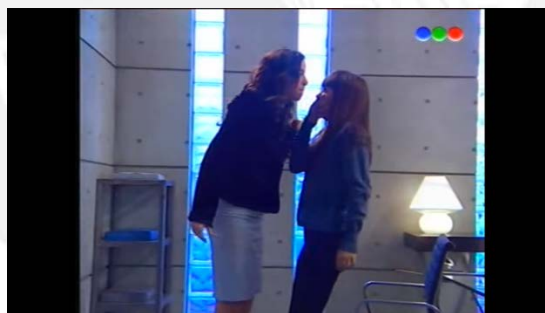
Figura 18: Capítulo 65 Cuarta temporada: Iluminación Oficina jefa de ministros “Casi Ángeles” 2013 18

En cuanto a la iluminación, podemos ver reforzada también esta dicotomía. En el “Ne” y “la oficina de la jefa de ministros” toda la iluminación es fría, con colores azulados o luz blanca, mientras que la luz cálida y natural, es utilizada únicamente en “La Resistencia”. Para una mayor comprensión, se pueden observar las imágenes 18 y 19 y 20.