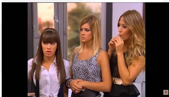
Figura 17: Capítulo 06 Cuarta temporada: Maquillaje chicas Ne “Casi Ángeles” 2013 17

14.15,16 y 17