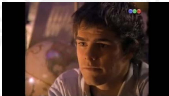
Figura 2: Capítulo 93 “La Verdadera Naturaleza del Amor” Casi Ángeles 2013 2