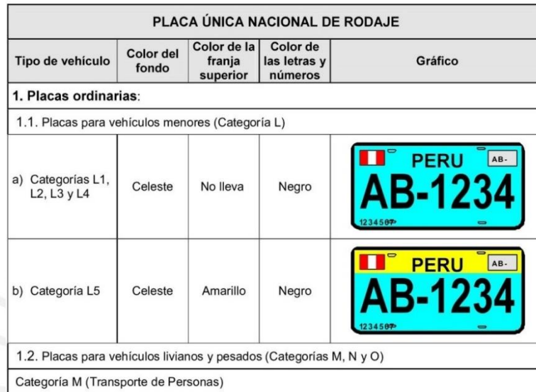
ANEXO I : CUADRO DE DISTRIBUCIÓN DE COLORES Y REPRESENTACIÓN GRÁFICA DE LA PLACA ÚNICA NACIONAL DE RODAJE