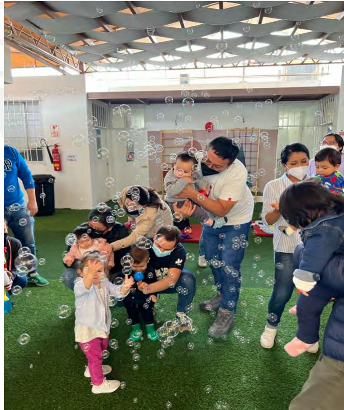
Foto 11: Niños de 0 a 3 años disfrutando de la experiencia sensorial con burbujas de jabón mientras suena la música de la guitarra.