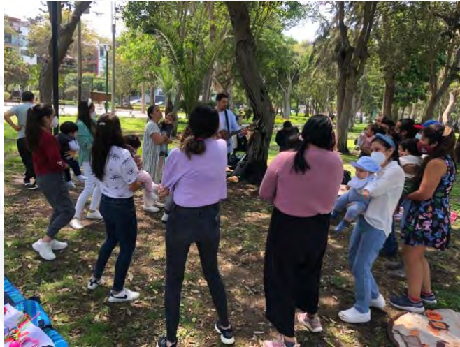
Foto 13: Padres arrullando a sus bebés al ritmo de la música y los cantos.