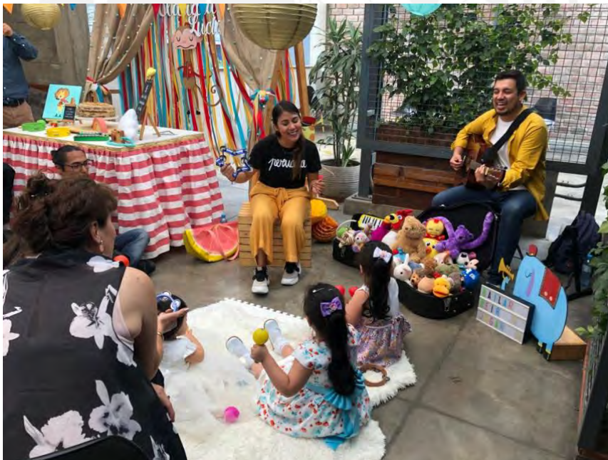
Foto 2: Niños y adultos disfrutando del sonido de la guitarra y de los cantos.