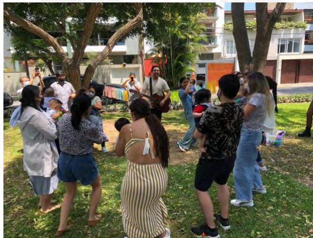
Foto 14: Bebés junto a sus padres disfrutando de la música y los cantos.