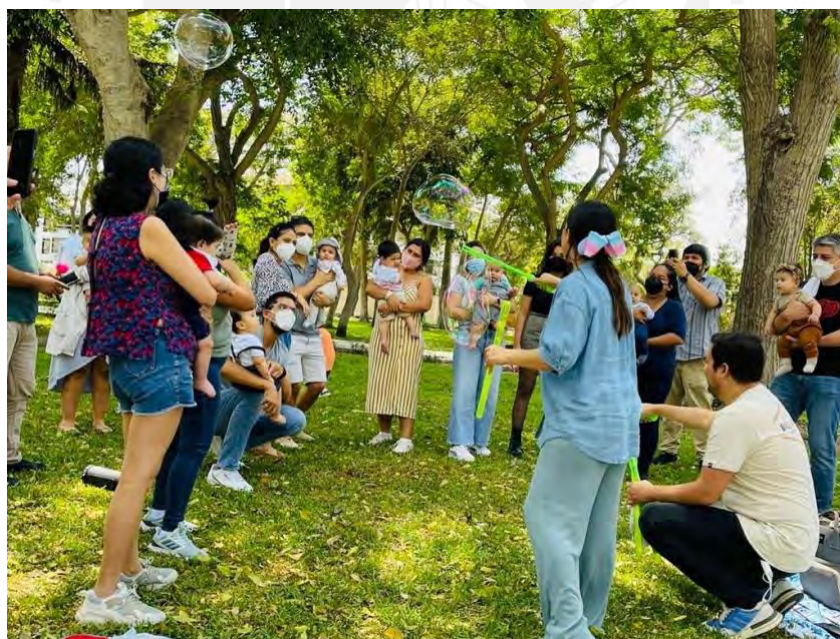
Foto 9: Padres y sus bebés disfrutando de una experiencia sensorial.