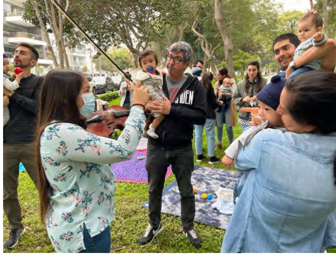
Foto 12: Padres arrullando a sus bebés al compás de la música del violín.