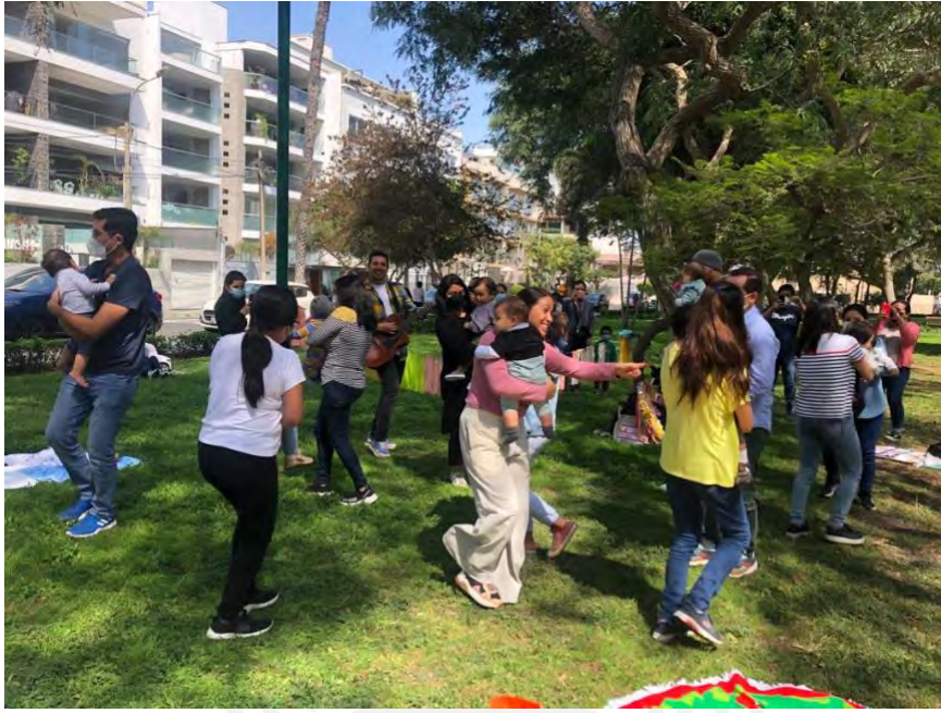
Foto 10: Momento de rondas y cantos junto a los padres y bebés que asisten a los talleres “Cantijuegos”