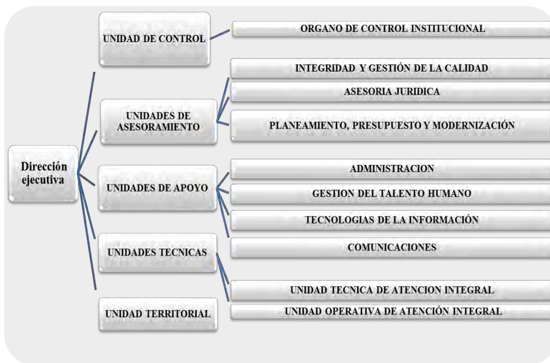
Gráfico N° 2.2: Organigrama del Programa Nacional Cuna Más