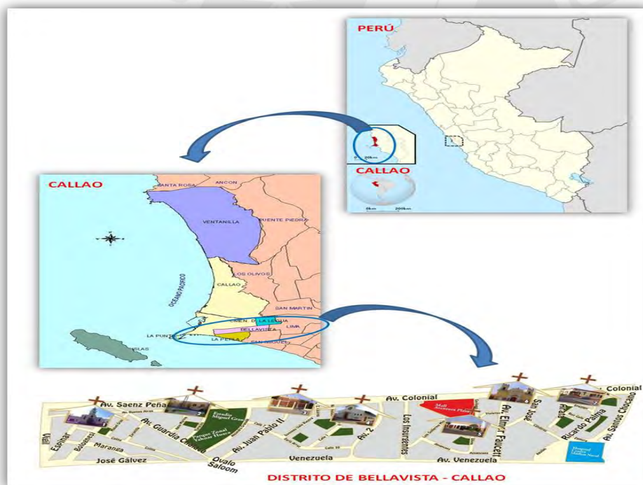
Figura 1: Mapa del Distrito de Bellavista

Según el portal de la Municipalidad Distrital de Bellavista es uno de los seis Distritos que conforman la Provincia Constitucional del Callao; fue creado el 6 de octubre de 1915 mediante la ley N° 2141.