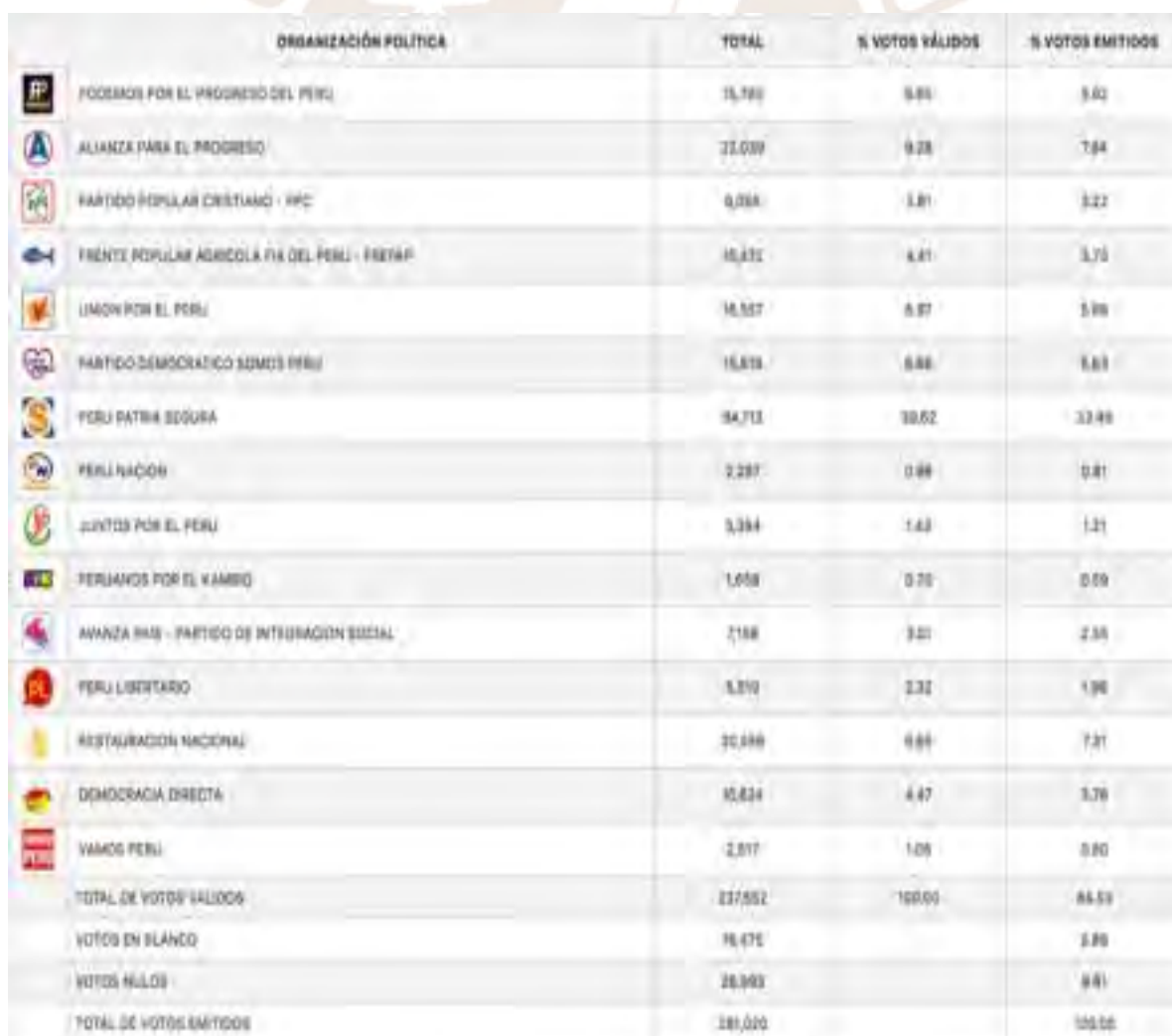
TABLA XI - RESULTADO ELECTORAL ELECCIONES MUNICIPALES 2018 VILLA MARÍA DEL TRIUNFO

Las diferencias obtenidas en los resultados electorales de las elecciones municipales del 2018, reflejan claramente el descontento ciudadano con su clase política local, y eso se denota en que el postulante a la alcaldía de Villa María del Triunfo que obtuvo el segundo lugar en las preferencias electorales obtuvo 9.28 % de los votos válidos (ONPE, 2018), se trata de la figura de un ex alcalde que gobierno el distrito en tres oportunidades anteriores.