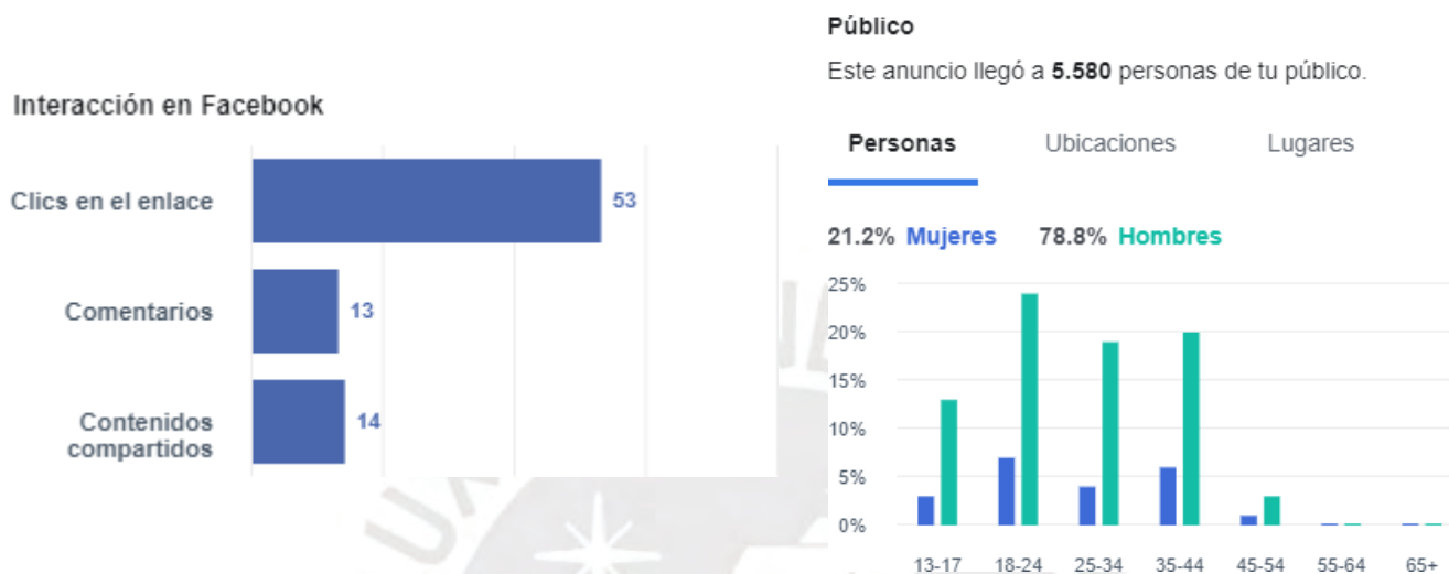
Estadísticas de Facebook por el primer post de FDS Deportes

reacciones (likes), comentarios y compartidos. Incluso, la interacción con la publicación permitió que 53 personas accedan al enlace que los dirigía a la nota en la web. Asimismo, las estadísticas de este post revelaron que casi el 80% de nuestra audiencia en Facebook son varones entre 13 y 65 años, provenientes de la ciudad de Lima.