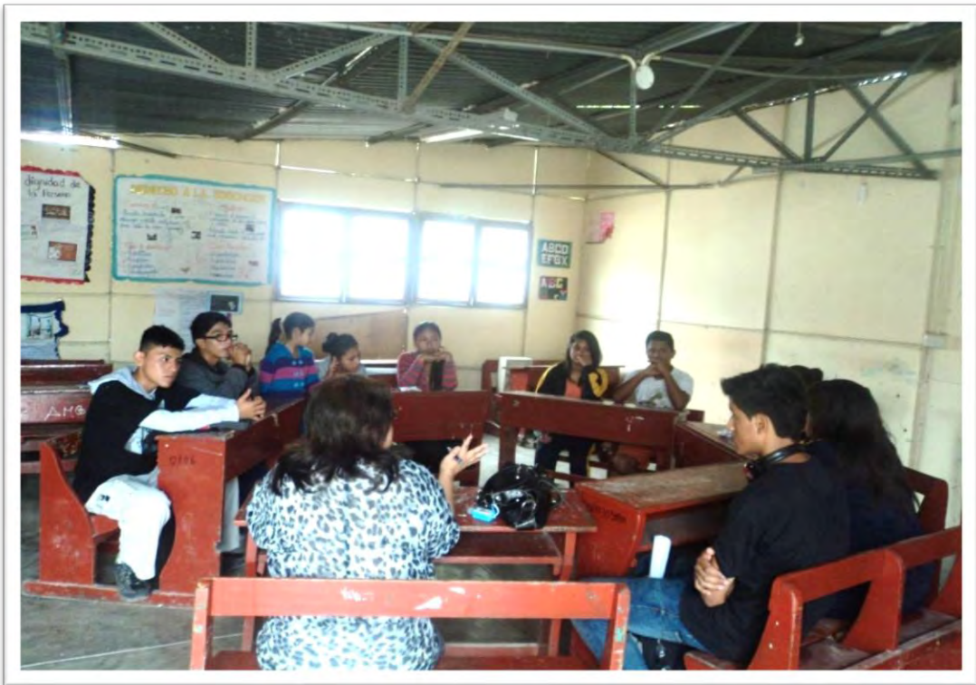
Alumnos líderes de IIEE en San Martín de Porres