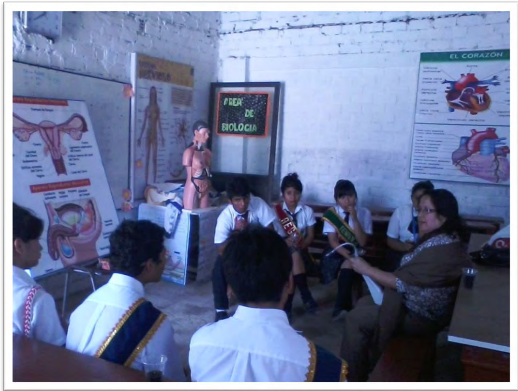
Alumnos líderes de IIEE en Villa El Salvador