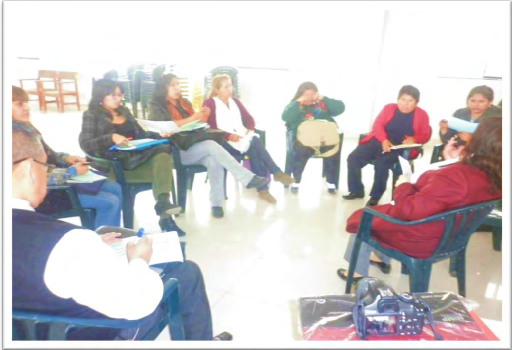
Promotores educadores de IIEE en Villa El Salvador