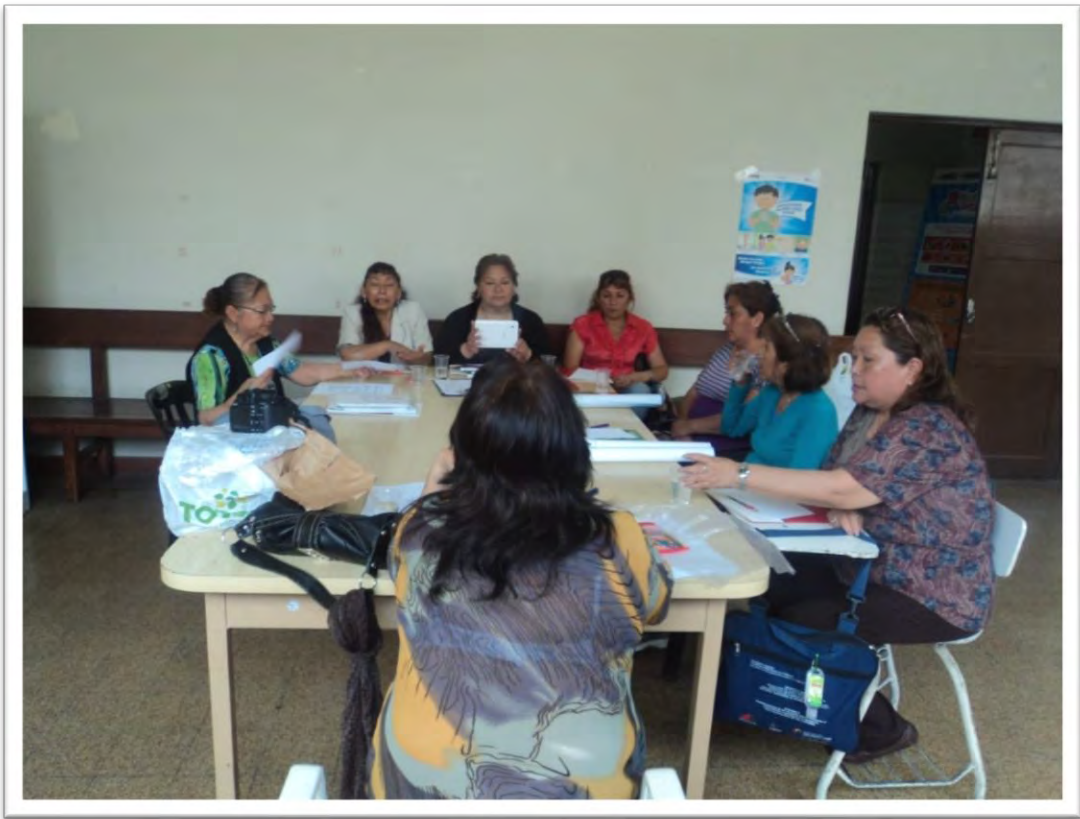
Promotores educadores de IIEE en San Martín de Porres