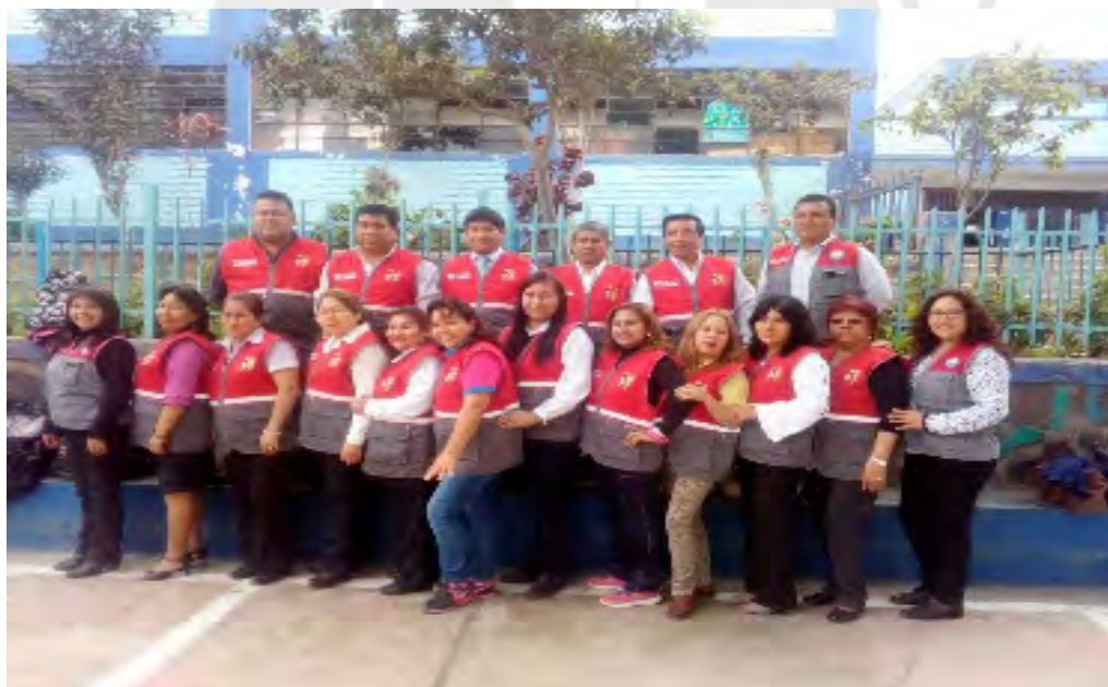
Fotografía N° 2 EQUIPO DE SOPORTE PEDAGÓGICO RED EDUCATIVA 02