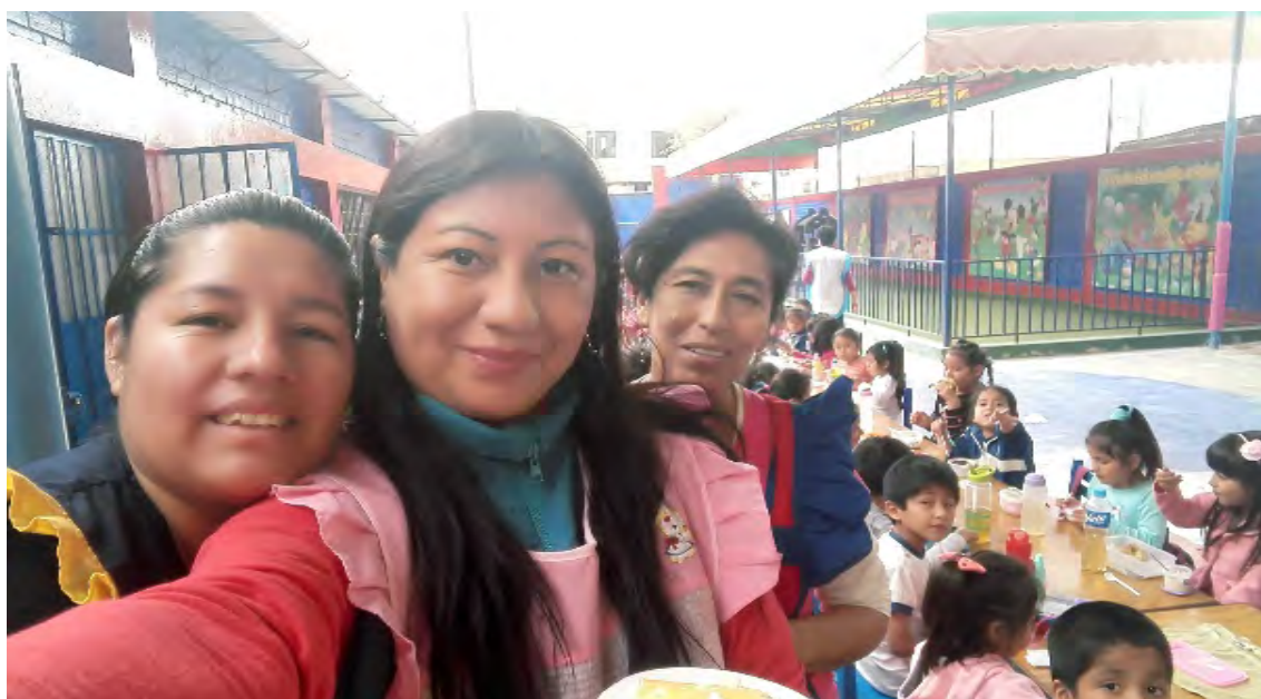
Fotografía N° 1 IEI MODULO LAS ANIMAS