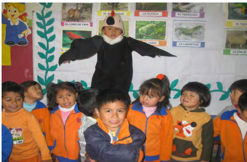
Fotografía N°4 NIÑOS DEL II CICLO DE IEI MODULO LAS ANIMAS