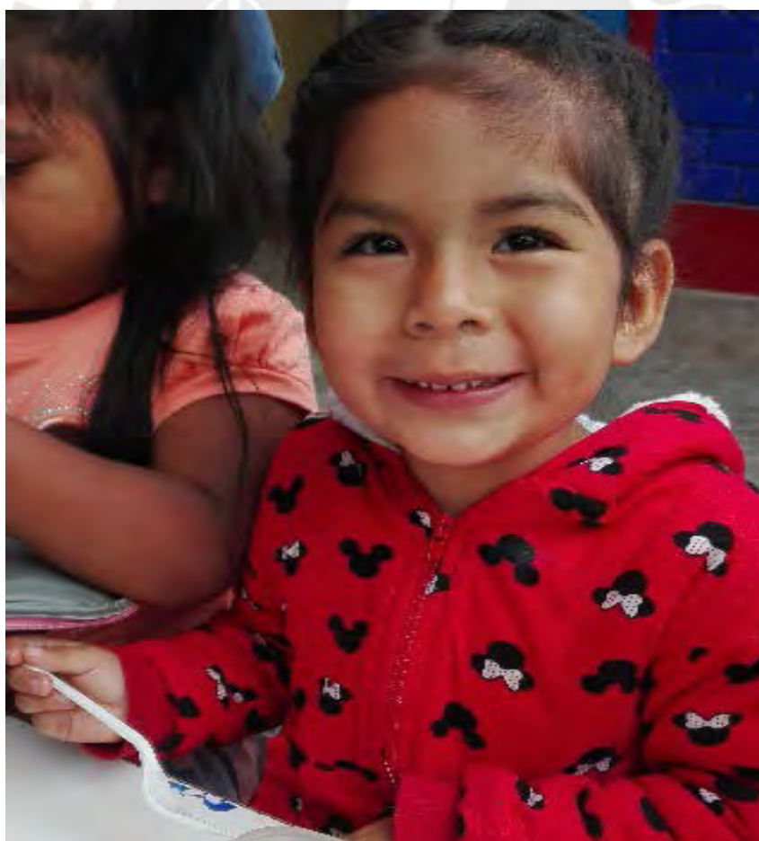
Fotografía N° 4 NIÑOS DEL II CICLO DE IEI MODULO LAS ANIMAS