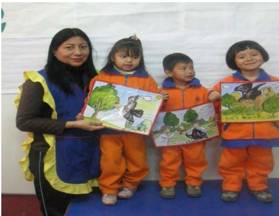
Fotografía N° 3 NIÑOS DEL II CICLO DE IEI MODULO LAS ANIMAS