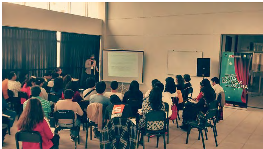
Figura 1. PASEE (Primer día)